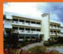
บรหาราชสีมา