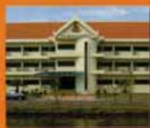
บรหาราชสีมา