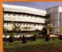
บุรีรัมย์