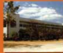
บุรีรัมย์