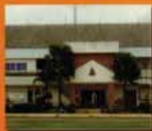
ปราจีนบุรี