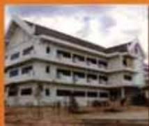
สุรินทร์