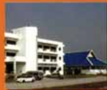
อุดรธานี