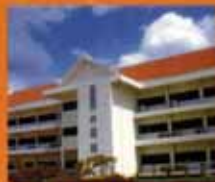
หนองบัวลำภู