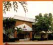
อุทัยธานี