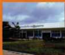
อำนาจเจริญ