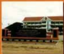
ตากใบบุรี