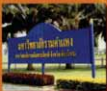
เชียงใหม่