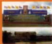
เพชรบูรณ์