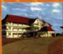
เชียงใหม่