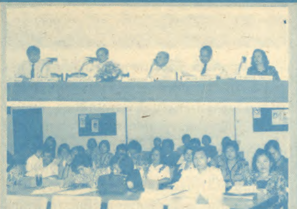
ประชุมสอบไล่ มหาวิทยาลัยรามคำแหงประชุมหัวหน้าคึกคอกและประธานกรรมการฝ่ายต่าง ๆ ในการสอบไล่ภาค 2/2537 เพื่อชี้แจงแนวปฏิบัติเกี่ยวกับการสอบ เมื่อวันที่ 10 มีนาคม 2538 ณ สำนักงานสภาอาจารย์