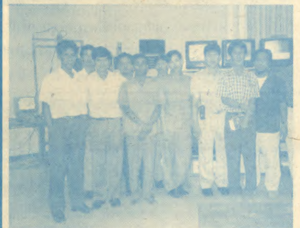
เมื่อวันที่ 8 มีนาคม 2538 คณะครูจากโรงเรียน เบญจมาฯ ชะเชิงเทรา 2 อำเภอเมือง จังหวัดฉะเชิงเทรา จำนวน 5 คน ได้เข้าเยี่ยมชมกิจการของงานโสตทัศนศึกษา สำนักเทคโนโลยีการศึกษา วิทยาเขตบางนา มหา- วิทยาลัยรามคำแหง เกี่ยวกับการวางระบบและการผลิต เพื่อนำเสนอรายการต่าง ๆ ด้วยระบบโทรทัศน์วงจรปิด และระบบการกระจายเสียงตามสายภายในมหาวิทยาลัย เพื่อนำไปประยุกต์ใช้ในกิจการของโรงเรียนต่อไป และการ เยี่ยมชมกิจการต่าง ๆ ของงานโสตทัศนศึกษา วิทยาเขต- บางนาในครั้งนี้ได้รับความสนใจจากคณะอาจารย์ผู้มา เยี่ยมชมอย่างยิ่ง