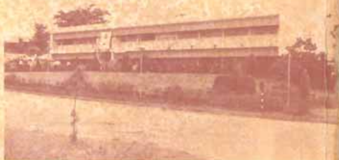
ศูนย์บริการฯ ศูนย์รวมวิชาการของชาว มร.