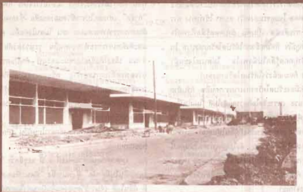
โครงสร้างการบริหารงาน วิทยาเขต