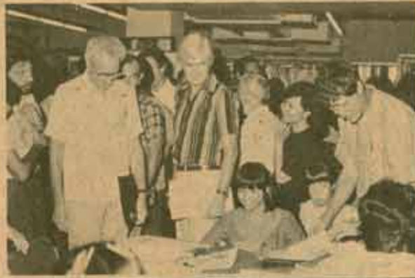
เมื่อ ม.ร. เมื่อวันที่ 16 สิงหาคม 2527 คณะผู้เข้าร่วมประชุมนานาชาติเรื่อง "อุดมศึกษาระบบเปิด" ซึ่งมหาวิทยาลัยรามคำแหงเป็นผู้จัด ได้มาเยี่ยมชมการดำเนินงานของ ม.ร. ซึ่งอธิการบดีได้ให้การต้อนรับ ณ ห้องประชุมคณะนิติศาสตร์ ชั้น 3 หลังจากนั้นนำชมการดำเนินงานของสำนักหอสมุดกลาง สวนและฝ่ายสำรวจ