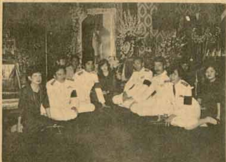
เคารพพระบรมศพ คณะผู้บริหารและผู้แทนจากมหาวิทยาลัยรามคำแหง ถวายบังคมพระบรมศพสมเด็จพระนางเจ้ารำไพพรรณี พระบรมราชินี ในรัชกาลที่ 7 เมื่อวันที่ 16 สิงหาคม 2527