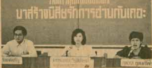
ชมรมภาษาอังกฤษและภาษาศาสตร์ จัดโครงการ "คุยกันก่อนเที่ยง" ที่รามคำแหง ๒ เมื่อวันที่ 14 สิงหาคม 2527 เป็นรายการของสำนักหอสมุดกลาง ม.ร. เรื่อง "มาสร้างนิสัยรักการอ่านกันเถอะ" ณ อาคารคณทิ (KTB) ชั้น ๒ - ๓