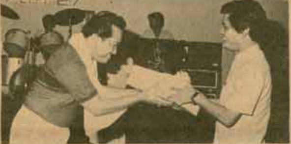
กีฬาภายใน คามที่สภาอาจารย์ม.ร. จัดการแข่งขันกีฬาภายในระหว่างอาจารย์ - ข้าราชการ จากหน่วยงานต่าง ๆ ระหว่างวันที่ 18 กรกฎาคม 2527 เป็นต้นมา นั้น ได้มีพิธีเปิดการแข่งขันกีฬาภายในเมื่อวันที่ 17 สิงหาคม 2527 ณ สำนักงานสภาอาจารย์