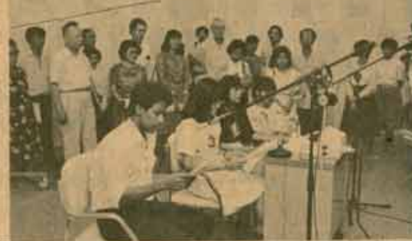
เมื่อ ม.ร. หลังจากเยี่ยมชมการดำเนินงานของ ม.ร. แล้ว ในตอนบ่ายของวันเดียวกัน คณะผู้เข้าร่วมประชุมนานาชาติ ได้ไปเยี่ยมชมการดำเนินงานของมหาวิทยาลัยสุโขทัยธรรมศาสตร์ ณ ศูนย์ผลิตรายการวิทยุและโทรทัศน์เพื่อการศึกษา ปากเกร็ด นนทบุรี