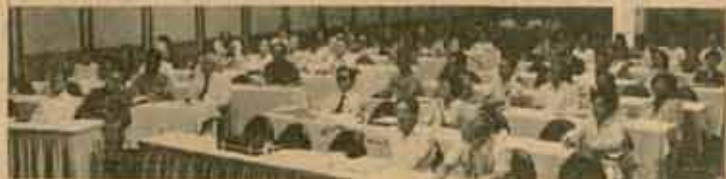
ประชุมนานาชาติ รศ.คุณ เวตสกล อธิการบดีมหาวิทยาลัยรามคำแหง เป็นประธานในพิธีเปิดการประชุมนานาชาติ เรื่องอุดมศึกษาระบบเปิด หรือ Open Higher Education ซึ่งมหาวิทยาลัยรามคำแหงเป็นเจ้าภาพจัดการประชุม เมื่อวันที่ 17 สิงหาคม 2527 ณ ห้องวิภาวดี บอลรูม โรงแรมไฮแอท เซ็นทรัล ทลาซ่า