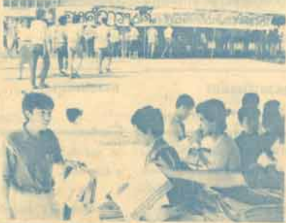
แจกตารางสอบ... อคต. ได้จัดพิมพ์ตารางสอบในส่วนที่มีกระบวนการแปลงจากนักศึกษาลง ตั้งแต่วันที่ 8 ธันวาคม 2526 เป็นต้นมา ณ เฝ้าที่ ประตูทางเข้าหน้ามหาวิทยาลัย