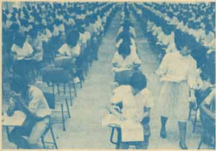
ชีวิตสอบกลับคืน หลังจากการขอขยายการสอบอย่างกระวนกระวายมาพร้อม 2 เดือน เพราะน้ำท่วมตั้งแต่ 11 ธ.ค. เป็นต้นมา ทุกคนกลับมาสูดสนามสอบตามเดิมจนถึง 29 ธ.ค. นี้

เรียนทางไปรษณีย์ เริ่มตั้งแต่บัดนี้จนถึงวันที่ 4 มกราคม 2527 ซึ่งเป็นวันสุดท้ายของการลงทะเบียนเรียนทางไปรษณีย์ และกำหนดการสอบในภาค 2/2527 ระหว่างวันที่ 19 มีนาคม-11 เมษายน 2527 วันที่ 12 เมษายน 2527