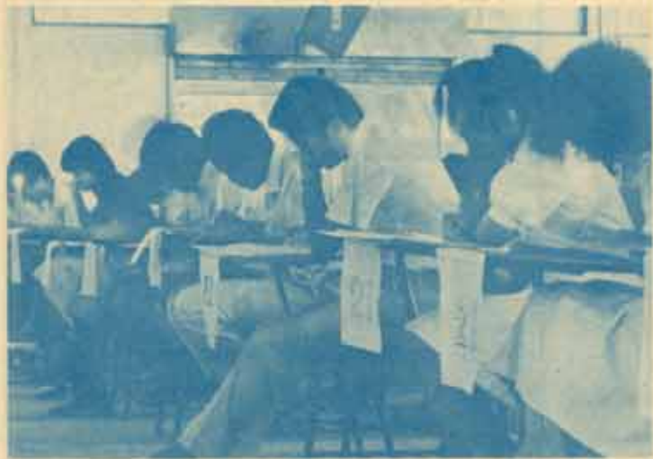
ได้แสงเทียน การสอบไล่ที่ 1 เมื่อวันที่ 14 ธ.ค. 26 ซึ่งมหาวิทยาลัยมีความจำเป็นจะต้องตัดกระแสไฟฟ้าทั้งมหาวิทยาลัยเป็นเวลา 1 ชั่วโมง เพื่อลดกระแสไฟแรงสูงเข้ามาวิทยาลัย ทำให้ห้องสอบบางแห่งนักศึกษาต้องสอบภายใต้แสงเทียน