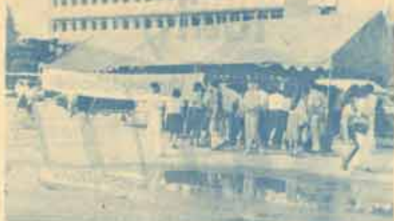
ปชต.กทอชย เฝ้าที่ประชาสัมพันธ์การสอบ นริเวณประตูทางเข้าหน้ามหาวิทยาลัย สำหรับบริการให้ข้อมูลแก่นักศึกษา และแจกตารางสอบไล่ฉบับเต็ม