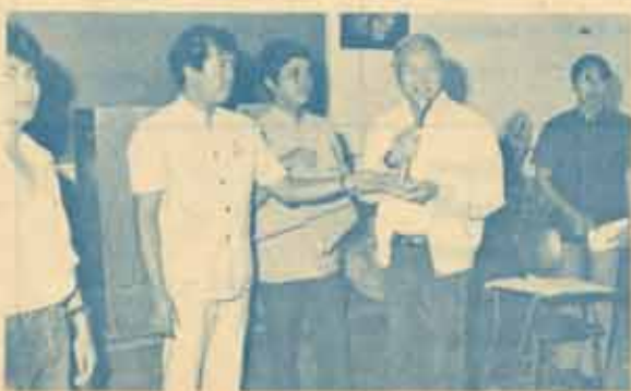
ผู้บริหารรอต้อนรับ