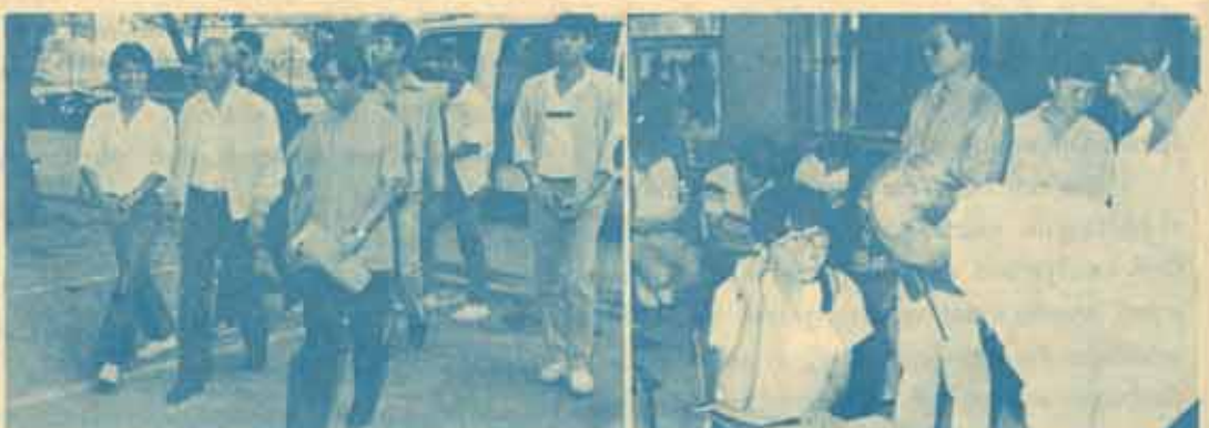
ขอให้โชคดีนะคุณ พลเอกเปรม ติณสูลานนท์ นายกรัฐมนตรีเป็นห่วงการสอบของรามฯ มาดูด้วยตนเองว่า หลังน้ำลดจัดสอบได้เรียบร้อยหรือไม่ เมื่อเช้า 11 ธ.ค. นี้โดยพจนานุกรมว่า "ขอให้โชคดีนะคุณ"