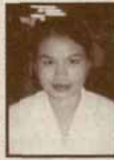
ซานยาต ซานยาต คหาว-นิลแดง บริษัท แสง

"สมัครเรียนคณะบริหารธุรกิจ สาขาการตลาด เข้ามาที่นี่ รู้สึกว่า เป็นมหาวิทยาลัยที่กว้างใหญ่ บรรยากาศอบอุ่น เหตุผลที่เลือก เรียนที่นี่ก็เพราะเราทำงาน ประหยัด ค่าใช้จ่าย เปรียบเทียบกับไม่มีเวลาเรียน สังคมยอมรับคุณภาพของรามคำแหง คนทุกคนชื่นชมสามารถเรียนได้ ทั้งที่ทำงาน เราไม่เสียเวลาเรียน ว่าจะเรียนจบภายใน 3 ปีค่ะ"