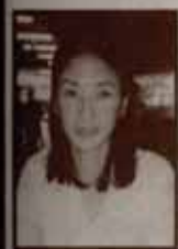
ซานยาต ซานยาต คหาว-นิลแดง

คิดว่าคนที่เรียนรามฯ ได้ คงต้องจริง ๆ ซะนี่ ต้องรับผิดชอบ ตัวเองให้ได้จริงๆ ส่วนวิธีการเรียนของผมก็เหมือนจะเรียนที่ รามคำแหงบางครั้งบางคราวและแบ่งเวลาเรียนตามตารางสอบ โดยจะไม่รับงานแสดงเลยในช่วงนั้น ส่วนการร่วมกิจกรรม มหาวิทยาลัยนั้น ผมคิดว่าจะร่วมกิจกรรมกีฬาฟุตบอล