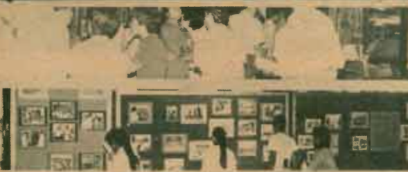
นิทรรศการ คณะกรรมการประชาสัมพันธ์ มหาวิทยาลัยรามคำแหง จัดนิทรรศการการศึกษาต่อ น.ร. ณ บริเวณห้องโถง กรมประชาสัมพันธ์ เพื่อเป็นการแนะนำการศึกษาในมหาวิทยาลัยรามคำแหงและการรับสมัครนักศึกษาใหม่ในปีนี้ เมื่อวันที่ 9 - 13 มิถุนายน 2527