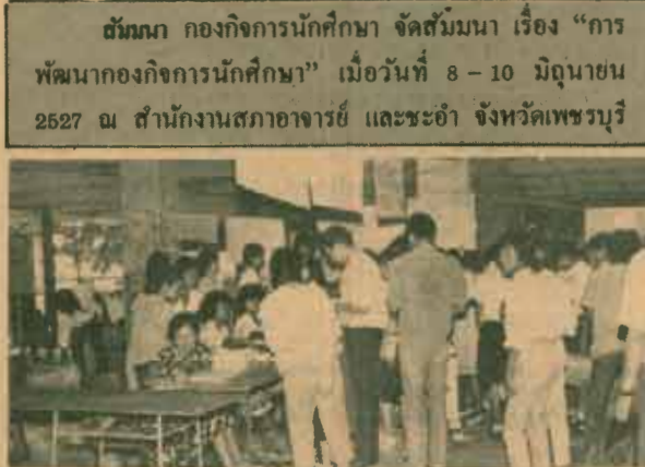
เจ้าหน้าที่ร่า ฝ่ายตำราฯ นำตำราชุด ของชั้นปีที่ 1 ไปจำหน่ายแก่นักศึกษาใหม่ ณ สถานที่รับสมัคร ทั้ง 2 แห่ง คือ ชั้นล่าง อาคารโรงโกลาต (KLB) และอาคารศิลาอาสน์ (SAB) ในระหว่างวันที่ 11-26 มิถุนายน 2527