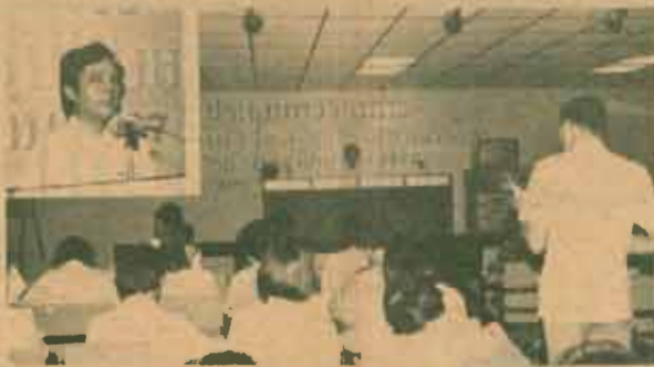
ปรับปรุงหลักสูตร คณะมนุษยศาสตร์ มหาวิทยาลัยรามคำแหง จัดการประชุมทางวิชาการเพื่อปรับปรุงหลักสูตรคณะมนุษยศาสตร์ ให้ทันสมัยและสอดคล้องสังคมปัจจุบัน เมื่อวันที่ 11-12 มิถุนายน 2527 ณ สำนักงานสภาอาจารย์ และ ที่ทำการคณะมนุษยศาสตร์