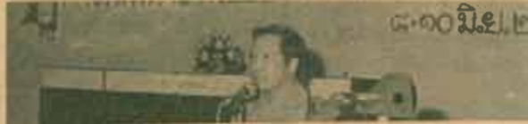
สัมมนา กองกิจการนักศึกษา จัดสัมมนา เรื่อง "การพัฒนาองคกิจการนักศึกษา" เมื่อวันที่ 8-10 มิถุนายน 2527 ณ สำนักงานสภาอาจารย์ และระอ้า จังหวัดเพชรบุรี