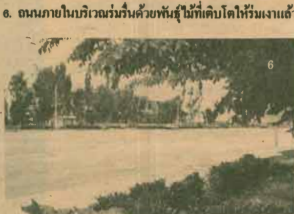
6. ถนนภายในบริเวณร่มรื่นด้วยพันธุ์ไม้ที่เติบโตให้ร่มเงาแล้ว