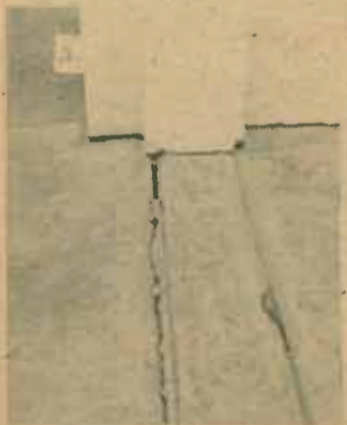
3. รอยแตกของพื้นรอบอาคารชั้นเดียว