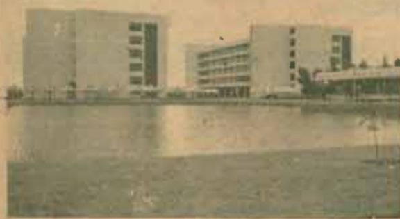
7. อาคารเรียนห้าชั้นทั้ง 3 หลัง อยู่ในสภาพพร้อมที่จะเป็นที่เรียน

งานตัว และการฝึกเรียนวิชาทหาร จึงประกาศให้ทราบทั่วกัน.