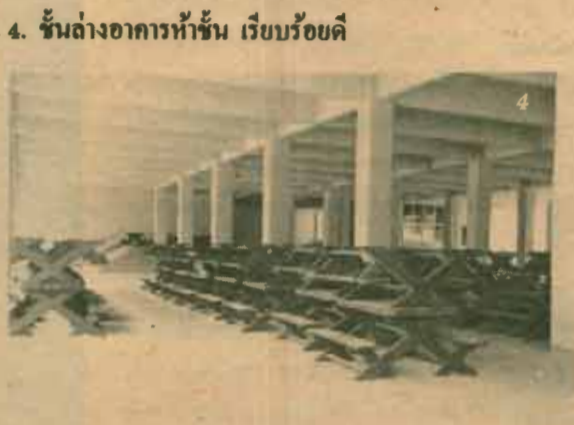
4. ชั้นล่างอาคารห้าชั้น เรียบร้อยดี