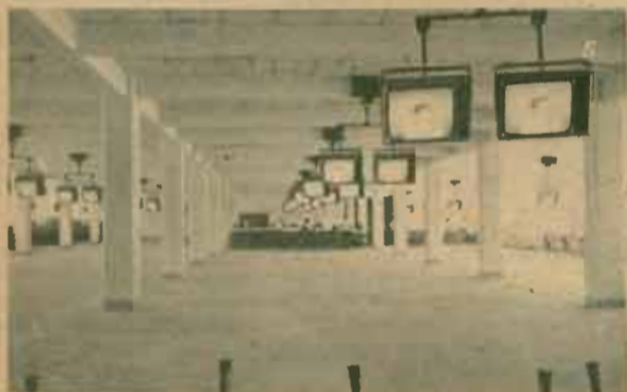
5. ชั้นสองถึงชั้นสี่อาคารห้าชั้นมีสภาพเช่นนี้