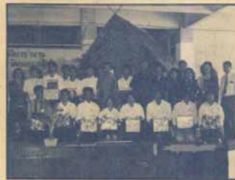
มหาวิทยาลัยรามคำแหงกับการรณรงค์เพื่อวัฒนธรรมไทย

6. ร่วมมือกับคณะผู้บริหารมหาวิทยาลัยในการเตรียมการก่อตั้ง 'มูลนิธิพระสิริสมุทรคุณ' และการทอดผ้าป่าสามัคคี ที่วัดกลางวรวิหาร จังหวัดสมุทรปราการ