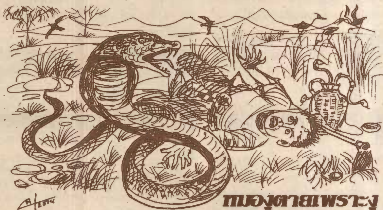
หมองูตายเพราะงู

เนื่องในปี สืบสายวัฒนธรรมไทย ผู้เขียนเห็นว่าน่าจะสืบสายสำนวนไทย โดยให้ความรู้ความเข้าใจว่าแต่ละสำนวนไทยมีความหมายอย่างไร โดยนำเสนอเป็นรูปภาพ มีคำกลอนบรรยายภาพ เพื่อให้จดจำได้ง่ายยิ่งขึ้น การใช้สำนวนไทยในการพูดและการเขียนนั้น เป็นเสน่ห์อย่างหนึ่ง นอกจากจะแสดงถึงความสามารถในการใช้ภาษาและชะตาซึ่งในวันธรรมไทยแล้ว ยังแสดงถึงภูมิปัญญาในการสรุปความได้อย่างกินใจ จึงขอเชิญชวนให้สำนวนไทยในการพูดและการเขียนเพื่อแสดงเอกลักษณ์ของความเป็นไทย