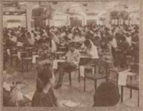
สอบไล่ มหาวิทยาลัยรามคำแหง ได้ดำเนินการสอบซ่อมภาค ๒ และภาคฤดูร้อน ปีการศึกษา ๒๕๓๗ ระหว่างวันที่ ๒๑-๓๐ สิงหาคม ๒๕๓๘ (โดยเว้นวันอาทิตย์ที่ ๒๗ สิงหาคม ๒๕๓๘)