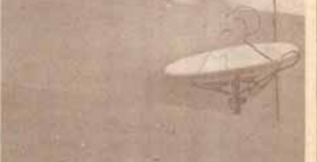
เนื่องหลังการเรียนฯ จากเริ่มสัญญาณภาพและเสียงผ่านดาวเทียม ที่หลังคาอาคารวิทยบริการ ม.ร. สาขาวิทยบริการ ทำให้นักศึกษามีโอกาสได้ฟังคำบรรยายของอาจารย์จากกรุงเทพฯโดยไม่ต้องมาขอได้ คล้าย ๆ กับการรับวิทยุรับฟังเสียงวิทยุกระจายเสียง...