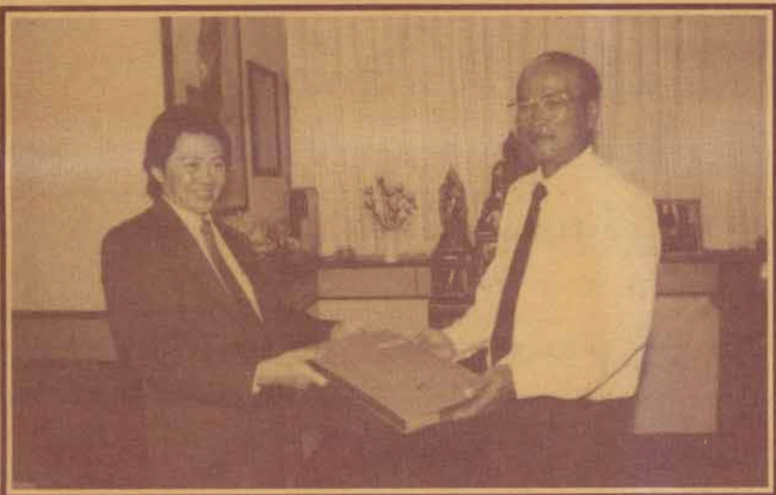
รับมอบงาน รศ.รังสรรค์ แสงสุข อธิการบดีมหาวิทยาลัยรามคำแหง รับมอบงานจาก รศ.ดร.ไพบุลย์ ภูริเวทย์ คณบดีคณะวิทยาศาสตร์รักษาการแทน อธิการบดี เมื่อวันที่ 28 มีนาคม 2539 ณ ตึกสำนักงานอธิการบดี ชั้น 2

ปีที่ ๒๕ ฉบับที่ ๕๔ วันที่ ๑ - ๗ เมษายน ๒๕๓๙