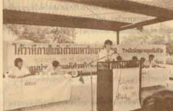
ได้วาทิ ชมรมปฐกถาและได้วาทิ ม.ร. จัดการแข่งขันได้วาทิภายในจังหวัดขอนแก่นวิทยลัยรอบแรก เมื่อวันที่ 28 - 29 สิงหาคม ที่ผ่านมา ณ บริเวณศาลาชาวนหิน 2