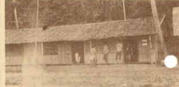
ออกค่าย ภาพของโรงเรียนบ้านน้ำขาว ตำบลปากจั่น อ.เมือง จ.ระนอง ซึ่งชมรมค่ายอาสาพัฒนาธรรม - ทักษิณ ได้สำรวจมาแล้ว เพื่อออกค่ายอาสาพัฒนาโรงเรียนแห่งนี้ ในวันที่ พฤศจิกายน - 5 ธันวาคม นี้