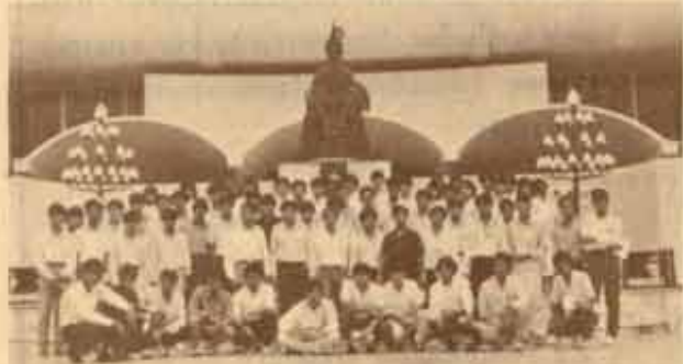
พิธีประชุมรัฐสภา เมื่อวันที่ 27 สิงหาคม 2529 พรรคพัฒนาปัญญาชน ได้นำนักศึกษาจำนวน 65 คน ไปฟังการประชุมร่วมกันของสภาผู้แทนราษฎรและวุฒิสภา ในวาระรัฐบาลแถลงนโยบายต่อที่ประชุมรัฐสภา โดยได้เข้าฟังในช่วงบ่าย ภาพหลังจากที่ประชุมมีมติให้ประชุมโดยเปิดเผยได้แล้ว