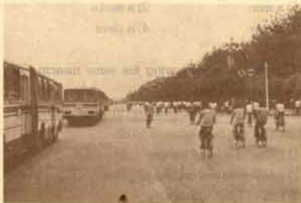
ถนนฉางอันในกรุงปักกิ่ง