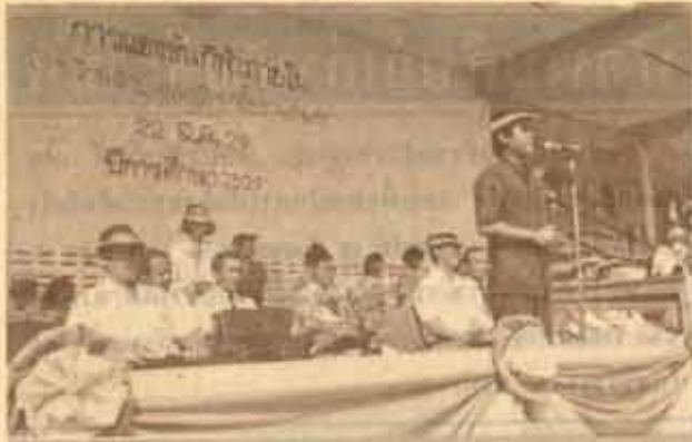
ที่พาสจัด ม.ร. วศ.สุโขม นวดสฤต อธิการบดีมหาวิทยาลัยรามคำแหง เป็นประธานเปิดการแข่งขันกีฬาภายในของโรงเรียนสาธิตมหาวิทยาลัยรามคำแหง ประจำปีการศึกษา 2529 เมื่อวันที่ 22 สิงหาคม 2529 ณ สนามกีฬา ม.ร.