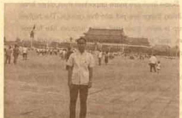
ผู้เขียนที่จัตุรัสเทียนอันเหมิน