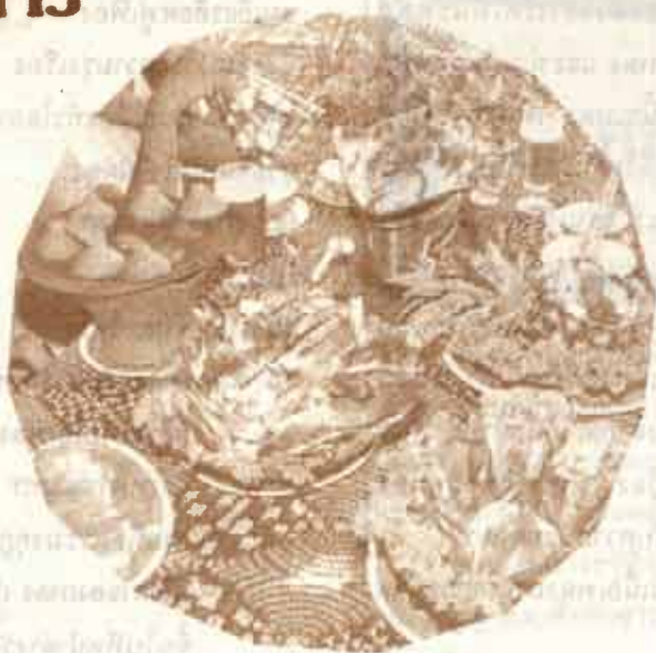
ผศ.ดร. ไพบูลย์ ภุชเวทย์ คณะวิทยาศาสตร์

คนส่วนมากชอบอาหารดี แต่โอกาสเลือกกินได้ตามใจชอบสัมพันธ์กับฐานะและรายได้ของแต่ละบุคคล ผู้มีอันจะกินส่วนมากพัฒนานิสัยโปรดปรานอาหารบางอย่างมาตั้งแต่เด็ก บางคนชอบอาหารทะเลราคาแพง บางคนชอบกินแต่เนื้อ บางคนก็หนีไกลไปอีกคือเลือกกินเนื้อและอวัยวะบางส่วนของวันและหมู บางคนก็ชอบแต่อาหารที่ทำยากเช่นเห็ดบางชนิด ไม่ว่าจะเลือกอาหารกินได้ตามใจชอบอย่างไร สิ่งทีคนเหล่านี้กลัวกันมากคือ ปัญหาน้ำหนักมากและโรคที่เกี่ยวกับความอ้วน