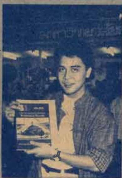
เป็นหนึ่งใน โชษชิต บัณฑิตคณะรัฐศาสตร์ ม.ร.

"รามคำแหงกำลังจำหน่ายใบสมัครนักศึกษาใหม่ และได้จัดพิมพ์ใบสมัครนักศึกษาแบบใหม่ สามารถใช้ได้ 2 ปีการศึกษา คือ 2531-2532 เชิญมาสมัครสมัครรับ เพียงราคาชุดละ 20 บาทเท่านั้น มีจำหน่ายที่อาคาร สวป. (หลังเก่า) สำนักหอสมุดกลาง ประชาสัมพันธ์ ม.ร. และงานกิจการและบริการนักศึกษา (รวมฯ 2 อาคาร PNB ชั้นล่าง) เริ่มรับสมัครที่ ม.ร. วันที่ 6-21 พฤษภาคม 2531 และที่ศูนย์การค้าเซ็นทรัลพลาซ่า วันที่ 11-21 พฤษภาคม 2531 สมัครช่วงนี้ เริ่มเรียนภาคฤดูร้อน 2/2530 เปิดบรรยายวันที่ 23 พฤษภาคม - 18 มิถุนายน 2531"