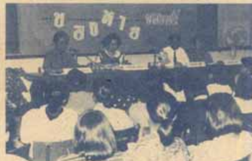
ของหาย ของฟรี เมื่อวันที่ 18 กันยายน 2534 งานกิจการและบริกรนักศึกษา รามา 2 จัดอภิปรายหัวข้อ 'ของหาย ของฟรี' ร่วมโครงการรณรงค์ความปลอดภัยในทรัพย์สินส่วนบุคคล โดยวิทยากรคือ อ.สุวรรณี วัฒนกุล อ.ผาณิต กันตมาระ อ.จตุพล ชมภูนิช และนายสมชาย หนองฮี