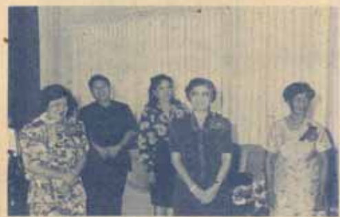
เกษียณอายุ คณะมนุษยศาสตร์ ม.ร. จัดงานเลี้ยงเกษียณอายุ แก่บุคลากร ประจำปี 2534 เมื่อวันที่ 4 ตุลาคม 2534 ณ ห้องประชุมคณะฯ