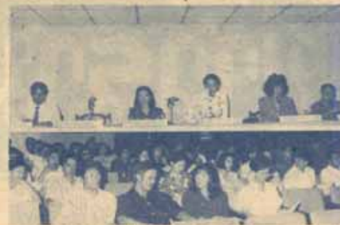
ประชุมสอบไล่ มหาวิทยาลัยประชุมหัวหน้าตึกสอบและประธานกรรมการฝ่ายต่างๆ เกี่ยวกับการสอบไล่ ภาค 1/2534 เมื่อวันที่ 9 ตุลาคม 2534 ณ สำนักงานสภาอาจารย์