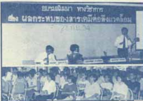
สารเคมีค่อสิ่งแวดล้อม เมื่อวันที่ 27 กันยายน

เรื่องเจ้าจันท์หม่อมนี้น่าสนใจและมีแง่มุมชวนคิดคงจะต้องพูดต่ออีกสักครั้งในคราวหน้า อย่าลืมอ่านต่อในฉบับหน้านะคะ (เป็นคอนอาสาน)