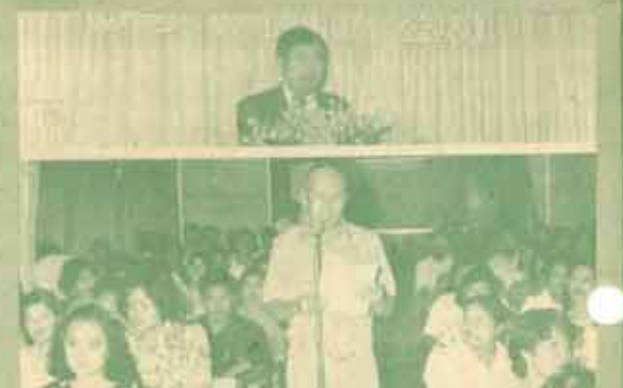
สัมมนา คณะรัฐศาสตร์ ม.ร. จัดสัมมนา เรื่อง "การเสริมสร้างประสิทธิภาพการทวงงานของคณะรัฐศาสตร์" ระหว่างวันที่ 5-7 สิงหาคม 2531 ณ ห้องประชุมคณะรัฐศาสตร์ ชั้น 4 และโรงแรมโอเรียนเต็ล เมืองพัทยา จังหวัดชลบุรี