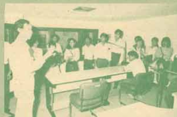
ดูงาน นิเทศปริญญาโท สาขาวิชาเทคโนโลยีการศึกษา จุฬาลงกรณ์มหาวิทยาลัย จำนวน 20 คน มาเยี่ยมชมสำนักงานเทคโนโลยีการศึกษา ม.ร. เพื่อขงแผนการผลิตรายภาควิชาการศึกษาและโทรทัศน์การศึกษา เมื่อวันที่ 2 สิงหาคม 2531 ณ อาคารภคาเมือง