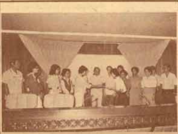
มอบทุนการศึกษา... ม.ร. ๒ เป็นผู้รับทุน จำนวน ๘,๐๐๐ บาท