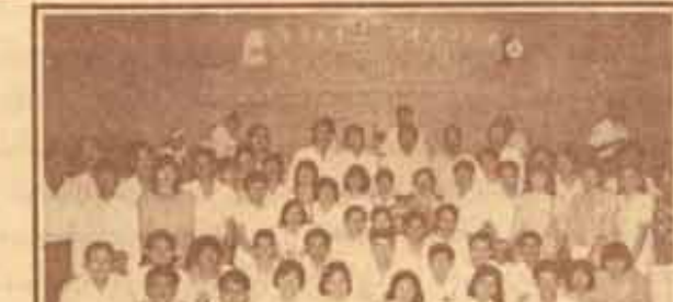
ชมรมปัญญา คีรีแก้วบุญชิวรามคำแหง ร่วมจัดตั้งชมรมนักศึกษาเก่าบัณฑิต ม.ร. และจัดงาน "๒๒ ปีรามคำแหง"...