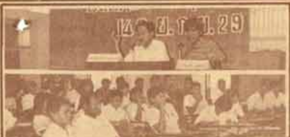
ประชุมใหญ่ เมื่อวันที่ 14 กันยายน 2529 ณ ห้องประชุมชั้น ๒...