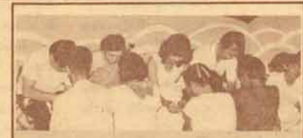
วันเดือนใหม่ ๒๑ ชมรมจิตวิทยา จัดงาน "กลุ่มสัมพันธ์" ณ ค่าย Y.M.C.A. เมืองพัทลุง...