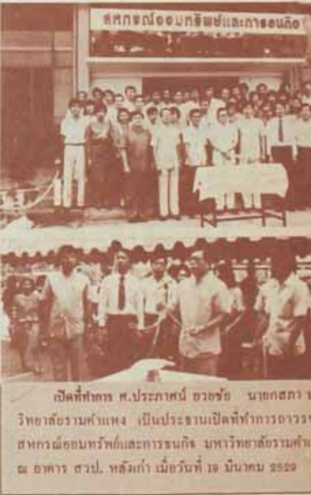
เปิดที่ที่ถกร ศ.ประกาศนั ฮวชชัย นชกสภานมหาวิทยาลัยรามคำแหง เป็นประธานเปิดที่ที่ถกรอารวสภกรณฉอนทรพคและกรณนคัง มหาวิทยาลัยรามคำแหง อาคาร สวป. หลังเก่า เมื่อวันที่ 19 มีนาคม 2529