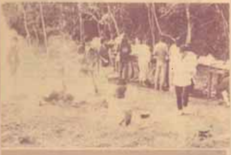
การประกอบอาหารของกลุ่มต่าง ๆ

กำแพงเพชร ถึงหลักกิโลเมตรที่ 414 เลี้ยวขวาเข้าตัวอุทยานอีก 16 กิโลเมตร เส้นทางนี้เป็นเส้นทางลูกรัง และแคบเมื่อผ่านไปครึ่งชั่วโมงจากทางแยกเราเริ่มเข้าสู่เชิงอุทยาน รดเริ่มขึ้นทางลาดชัน อากาศเย็นลงจนรู้สึกได้ สองข้างทางปกคลุมไปด้วยป่าทึบซึ่งแทบไม่น่าเชื่อเลยว่าดูโซซัดโซเซจะมีป่าทึบขนาดนี้ รดยังคงขึ้นเนินอย่างช้า ๆ ทำให้พวกเราลุกขึ้นขึ้นจากที่นั่งชงโรงกหน้าออกนอกรถดูวิวที่สนรอบข้างมีเสียงพูดคุยกันเบา ๆ ถึงอากาศในคืนนั้น ซึ่งแน่นอนอากาศต้องเย็นกว่าปกติ กลิ่นสาบป่าเตะจมูกทำให้รู้สึกถึงความวังเวงในคืนที่จะมาถึง ประกอบกับเวลานั้นเย็นมากแล้วทุกคนกระวีระวาดขนของลงจากรถ ช่วยกันกางเต็นท์และช่วยกันประกอบอาหาร ดูว่านายพอมสมควรเพราะเวลานั้นเป็นเวลาใกล้ค่ำ แต่ละกลุ่มแบ่งหน้าที่กันจนเห็นได้ชัด บ้างกางเต็นท์ บ้างหุงข้าว ทำกับข้าว บ้างล้างจาน ทุกคนช่วยกันราวกับว่าสนิทสนมกันมานานปี เป็นภาพที่หาดูไม่ได้ง่ายนักสำหรับชีวิตที่สับสนและชิงชังเด่นก้นอย่างสังคมเมือง กิจกรรมนี้มีส่วนสร้างความผูกพันทางด้านจิตใจหวังว่าเขาเหล่านั้นคงไม่ลืมง่าย ๆ