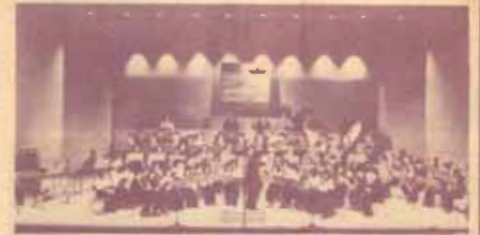
คณะนักศึกษามหาวิทยาลัยนครโอซาก้า ซึ่งเดินทางมาเยือนประเทศไทยเพื่อเปิดการแสดงคอนเสิร์ตที่มหาวิทยาลัยรามคำแหง ในวันที่ 22 มีนาคม นี้

ตามที่ "ข่าวรามคำแหง" ฉบับที่แล้วได้เสนอข่าวว่า คณะนักศึกษาจากมหาวิทยาลัยแห่งเมืองโอซาก้า (Osaka City University) ประเทศญี่ปุ่น จะเดินทางมาเยือนประเทศไทยและจะเปิดการแสดงคอนเสิร์ตที่มหาวิทยาลัยรามคำแหง ในวันศุกร์ที่ 27 มีนาคม 2530 ในเวลา 16.00 น. นั้น