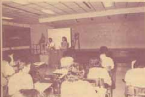
ฝึกอบรม คณะกรรมการดำเนินการพัฒนาและฝึกอบรม บุคลากรของ ม.ร. และระบบฝึกอบรม กองการเจ้าหน้าที่ จัดการฝึกอบรมเชิงปฏิบัติการ "การทำงานร่วมกันอย่างมีประสิทธิภาพ" เมื่อวันที่ 16-18 มีนาคม 2530 ณ ห้องประชุม ประมวล กุศลภรณ์ โดยมีเจ้าหน้าที่จากหน่วยงานต่าง ๆ ของมหาวิทยาลัย เข้าร่วมอบรม 40 คน