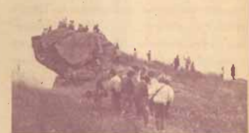
รอยรอยด้วยภาพพระอาทิตย์ขึ้นในทอนเข้านิวเวอ ยอดเขานารายณ์

ถ้ากฎระดังสร้างตำนานระหว่างหนุ่มสาวที่เดินขึ้น อุทยานแห่งชาติรามคำแหงหรือเขาหลวงแห่งนี้ น่าจะเป็นตำนานรักที่เข้มข้นกว่าเพราะภาพที่เห็นการปีนผาเพื่อคลายความเมื่อยของแต่ละกลุ่ม เป็นไปอย่างด้อยที่ถืออศัย ฝ่ายหนึ่งทะเลห้อยเพราะความเจ็บปวดเมื่อยล้าของกล้ามเนื้ออีกฝ่ายหนึ่งสอแวตว่าเป็นห่วง เพื่อนร่วมกลุ่มจะทำได้ก็ปีนผาประคองประคองกันจนถึงยอดเขาหลวง นำขึ้นชมกันจริง ๆ สำหรับตัวผมพอขึ้นถึงยอดก็ล้มลงเพราะกำลังขาไม่สามารถจะพยุงร่างกายให้ยืนต่อไปได้ เด็ก ๆ ก็ยังถามว่า “ไหวไหม?” ว่าแล้วก็ประคองให้ผมเข้านั่งพัก ความเหน็ดเหนื่อยหายไปไม่ใช่เพราะได้นั่งพักแต่เป็นเพราะความอาหารว่างของเพื่อนร่วมกลุ่มต่างหาก เราใช้เวลาพักตลอดจนทานอาหารกลางวันกันนานพอสมควร จากนั้นแต่ละกลุ่มก็แยกกันทำหน้าที่ ทั้งกางเต็นท์ หาพื้นหุงข้าว-หาพื้นเล่นแคมป์ มีเวลาวางช่วง 5 โมง ถึง 6 โมงเย็น ซึ่งทุกกลุ่มได้หุงอาหารและทำธุระส่วนตัวกันเรียบร้อยแล้ว คณะผู้ดำเนินการก็ประกาศว่า “ช่วงนี้เราจะไม่ดูพระอาทิตย์ตกที่ยอดพระเจดีย์ขอให้ทุกคนเตรียมตัวยอดพระเจดีย์ห่างจากที่พักประมาณกิโลเมตรเศษ ทางเดินขึ้น ลาดชันตลอดขอให้ทุกคนเตรียมเสื้อกันหนาวไว้เพราะพระอาทิตย์ตกแล้วอากาศจะเย็นลงทันที” เราเดินลัดป่าหลังที่พักช่วงแรกประมาณ 300 เมตร ผ่านป่ารกทึบ จากนั้นก็เดินสู่เนินหญ้าสดและคเคี้ยวไปตามไหล่เขาระหว่างทางที่มีหุบผาขวับ บางคนเริ่มเปิดหน้ากล้องขึ้นแอ็กชั่นถ่ายรูปกันอย่างสนุกสนาน เสียงหัวเราะ