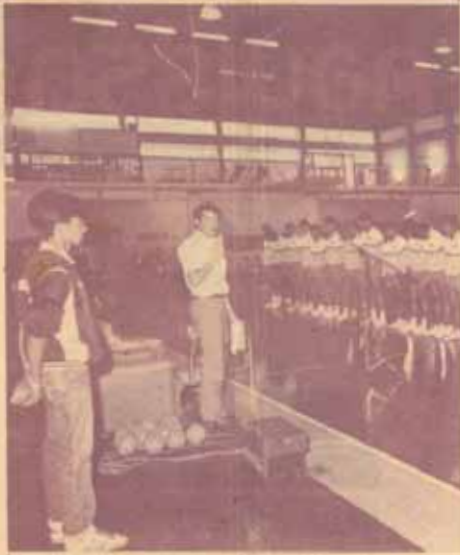
คณะกรรมาธิการคัดเลือก นักต่งหรือทีมชาติจากประเทศ มาเลเซียได้เดินทางมาเยือนประเทศไทยและคณะกรรมาธิการคัดเลือกทีมฟุตบอลชายทีมชาติไทย เมื่อวันที่ 12-15 มีนาคม 2530 ในโอกาสที่ได้มาแข่งขันกับคณะกรรมาธิการ มหาวิทยาลัยรามคำแหง เมื่อวันที่ 12 มีนาคม 2530 ณ โรงอิม 2 และมหาวิทยาลัยรามคำแหง ได้จัดงานเลี้ยงต้อนรับนักต่งหรือทีมชาติมาเลเซียด้วย