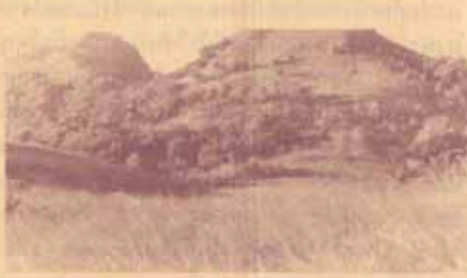
ทุ่งหญ้าสีทองระหว่างยอดเขาต่าง ๆ ในบริเวณอุทยานแห่งชาติรามคำแหง

บนยอดเขาลวงประกอบไปด้วยยอดเขาสูง 4 ยอดได้แก่ “ยอดเขานารายณ์” สูงจากระดับน้ำทะเล 1,160 เมตร “ยอดเขาพระแม่ย่า” สูง 1,200 เมตร