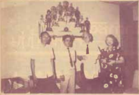
แหวะเข็ญศิษย์เก่า คร. อัลเบิร์ต ซอมมิต อดีตอธิการบดี มหาวิทยาลัยเซาเธอร์แลนด์ ออสเตรเลีย ที่ คาร์บอนเดล สหรัฐอเมริกา และภริยา ได้มาแหวะเข็ญอธิการบดีและคณาจารย์ของรามคำแหง มหาวิทยาลัยรามคำแหง เมื่อวันที่ 11 มีนาคม 2530