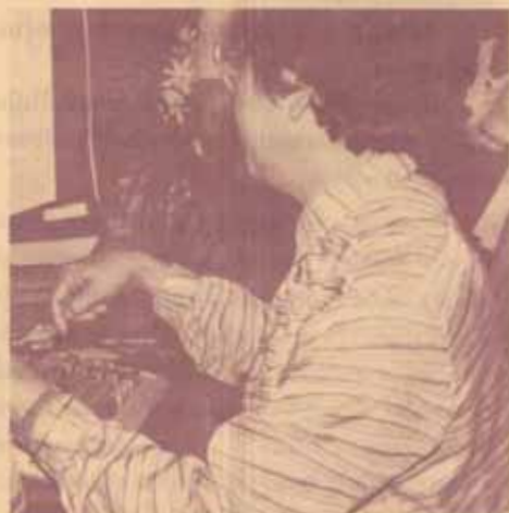
กำลังมีข้อมูลจากพีซีต่อกับฐานข้อมูลในสหรัฐอเมริกา

ห้องสมุดแห่งนี้ใช้เครื่องคอมพิวเตอร์ในการสั่งซื้อหนังสือและวารสารโดยพิมพ์ข้อมูลลงไปบนจอภาพ ซึ่งเครื่องนี้ก็ติดต่อไปที่ Walter Reed Institute of Research ในประเทศสหรัฐอเมริกา หนังสือและวารสารที่ทางห้องสมุดต้องการจะถูกจัดส่งมาให้โดยทาง Walter Reed เป็นผู้ซื้อและจัดส่งมาให้ทางเรืออากาศแบบ A.P.O. คือการจัดส่งของทหารอเมริกันซึ่งกินเวลาเร็วมาก เมื่อวันที่ 4 ก.พ. ผู้เขียนไปชมห้องสมุดนั้นได้เห็นวารสารฉบับเดือนกุมภาพันธ์หลายฉบับวางบนชั้นวารสารแล้ว ส่วนหนังสือนั้นทาง Walter Reed เขียนเลขหมู่ใส่ลงในหนังสือให้เรียบร้อย ทางห้องสมุด AFRIMS ก็เพียงแต่พิมพ์บัตรเท่านั้น นับว่าเป็นการสะดวกมาก ในการส่งจดหมายของห้องสมุดก็ใช้ระบบคอมพิวเตอร์ที่เรียกว่า electronic mail