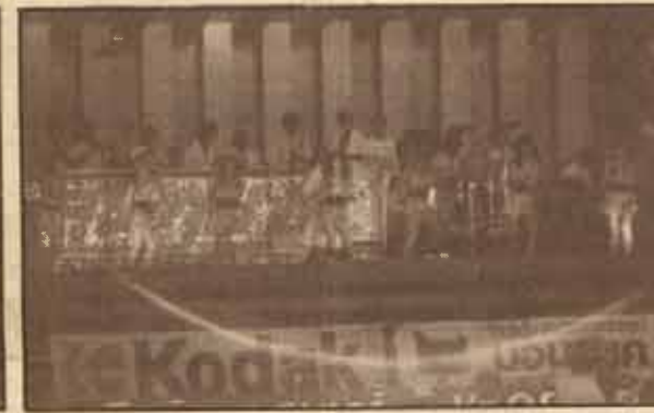
วงดนตรีลูกทุ่งสุโขทัย กับทางเครื่องสาวประเภทสอง