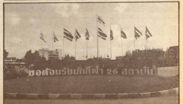
ขอต้อนรับนักกีฬา 26 สถาบัน

ศูนย์ข่าวกีฬา ภายในที่ทำการศูนย์ข่าวกีฬามหาวิทยาลัย (Press Center) ณ อาคาร NB 11 ซึ่งมีฝ่ายประมวลผล ทำหน้าที่รวบรวมผลการแข่งขัน และฝ่ายประชาสัมพันธ์ ทำหน้าที่ในการเผยแพร่ผลการแข่งขันและประสานกับสื่อมวลชน โดยมีผู้สื่อข่าวให้ความสนใจมาทำข่าวกีฬามหาวิทยาลัยเป็นจำนวนมากในแต่ละวัน