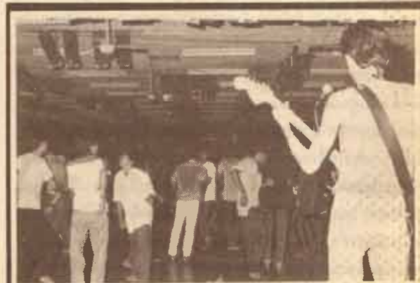
นันทนาการ ระหว่างการแข่งขันกีฬามหาวิทยาลัยฯ ครั้งที่ 13 ในช่วงกลางคืน มหาวิทยาลัยจัดรายการบันเทิงต่าง ๆ เพื่อเป็นนันทนาการแก่นักกีฬา ณ อาคาร NB 10

รางวัลที่ 1 เงิน 2,000 บาท พร้อมโล่เกียรติยศของมหาวิทยาลัยรามคำแหง รางวัลที่ 2 เงิน 1,500 บาท พร้อมใบประกาศเกียรติคุณ รางวัลที่ 3 เงิน 1,000 บาท พร้อมใบประกาศเกียรติคุณ เปิดรับสมัครตั้งแต่วันที่ 20 พฤศจิกายน 2528 ให้ติดต่อขอรายละเอียดและรับแบบฟอร์มใบสมัครได้ที่ วัดสังฆทาน ต.บางไผ่ อ.เมือง จ.นนทบุรี โทร. 4246157 หรือ งานกิจการและบริหารนักศึกษา กองงานวิทยาเขต มหาวิทยาลัยรามคำแหง 2 ถนนบางนา - ตราด ก.ม. 8 แขวงคอกไม้ เขตพระโขนง กรุงเทพฯ โทร. 3131472