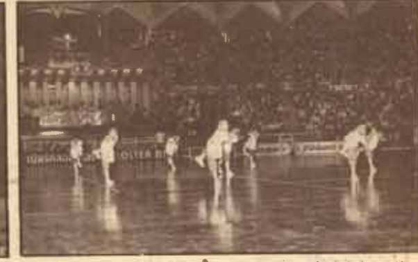
การรำมวยจีน จากนักเรียน ร.ร.ลำสาดี เขตบางกะปิ