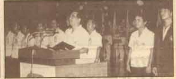
รัฐมนตรีทบวงมหาวิทยาลัย กล่าวรายงาน