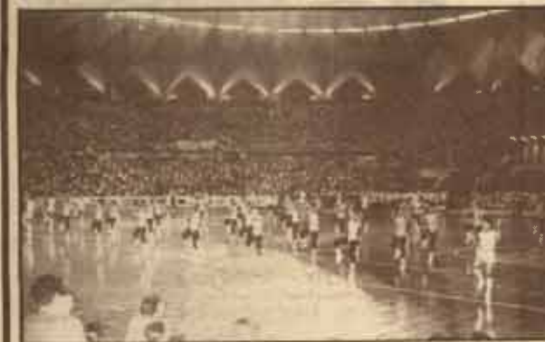
การเดินแอโรบิค จาก คณะศึกษาศาสตร์ ม.ร.