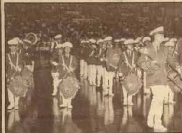
วงโยชวาทิต จาก ร.ร.มัธยมสาธิตรามคำแหง นำขบวนพาเหรด นักกีฬา