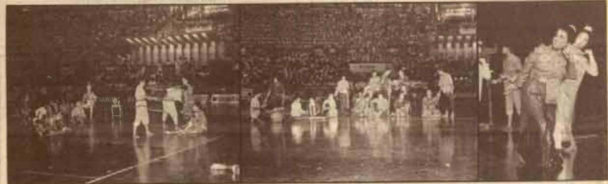
การแสดงประกอบแสงและเสียง ชุดเทอดพระเกียรติพ่อขุนรามคำแหงมหาราช จากชมรมศิลปะและการแสดง ม.ร.