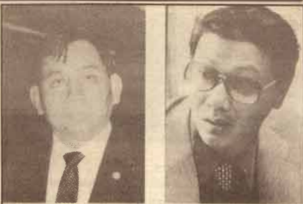
พ.ร. รุ่งแสง

ประการแรก ในเรื่องของฝ่ายบริหาร ซึ่งตามพรบ. ฉบับปี 2518 ได้กำหนดไว้ให้มีการเลือกตั้งผู้ว่าฯ 1 คน และรองผู้ว่าฯ อีก 4 คน ซึ่งในการเลือกตั้งนั้นต้องเลือกเป็นทีม จะส่งผู้สมัคร