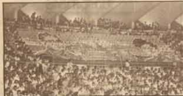
ชมรมเชียร์และการแปรอักษร