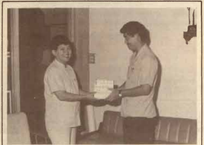
มอบฟิล์ม ผู้แทนบริษัท โกดัก (ประเทศไทย) จำกัด ได้มอบ ฟิล์มจำนวนหนึ่งให้มหาวิทยาลัยรามคำแหง ใช้ในการ บันทึกภาพการ แข่งขันกีฬามหาวิทยาลัยฯ ครั้งที่ 13

กรุณาอ่านงานให้ทราบแล้วถึงความมุ่งหมายของการร่วมกันเล่นกีฬามหา วิทยาลัยในครั้งนี้ ก็เพื่อที่จะพัฒนาการคุณภาพชีวิตของพวกเราในเชิงการ กีฬาให้เจริญก้าวหน้าต่อไป ที่ผมเรียนว่าทุกคนคงไม่ลืมคือมีคนกล่าวกันว่า นะครับว่า กีฬาทำคนให้เป็นคน คงจะมีความหมายลึกซึ้งและกว้างขวางมาก และผมคิดว่าคงจะไม่มีคำอธิบายสำหรับพวกเราที่เป็นนักกีฬา มาจากสถาบันชั้นสูง ผมคิดว่าทุกคนคงเข้าใจว่าคนต้องเคารพกติกา ต้องเคารพ กฎหมาย ต้องเคารพระเบียบวินัย และการกีฬาชนะคือบ่อเกิดของสิ่งเหล่านั้น ผมถึงมีความภาคภูมิใจอย่างเต็มที่ที่ทบวงมหาวิทยาลัยได้จัดให้มีการแข่งขันกีฬา ขึ้นถึง 13 ครั้งแล้ว แล้วครั้งนี้เป็นครั้งแรกที่สถาบันเอกชนได้เข้ามามีส่วน ร่วมด้วย นอกจากจะทำให้เกิดความเข้าใจระหว่างสถาบันของรัฐบาลและ สถาบันของเอกชนแล้ว ก็ยังทำให้เกิดความมั่นคงแข็งแรง ความเจริญเติบโต ของการกีฬา ของชาติบ้านเมืองของเราอีกด้วย ผมขอแสดงความยินดีกับ ความคิดที่นำสรรเสริญของทบวงมหาวิทยาลัย และคณะกรรมการ การ จัดการแข่งขันกีฬาของทบวงมหาวิทยาลัยครับ ผมขอเรียนขอแสดงความยินดี อีกครั้งหนึ่ง ขออวยพรให้การแข่งขันกีฬาระหว่างมหาวิทยาลัย ได้เป็นไป ตามวัตถุประสงค์ของพวกเราที่หวังจะเห็นการกีฬาเป็นสื่ออันดีที่สร้างสรรค์ ทางที่ดี แก่ชาติบ้านเมืองทุกประการ ณ บัดนี้ถึงเวลาอันสมควรแล้วนะครับ ผมขอเปิดการแข่งขันกีฬามหาวิทยาลัย ครั้งที่ 13 ณ บัดนี้ครับ ขอพระคุณ