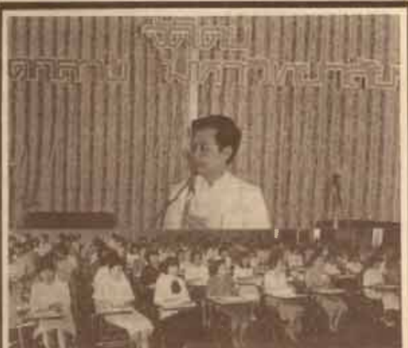
ฝึกอบรม รัฐมนตรีว่าการกระทรวงศึกษาธิการ นายชวน หลีกภัย เป็นประธานเปิดการฝึกอบรม เรื่อง "การจัดกิจกรรมห้องสมุด" แก่ครู อาจารย์ บรรณารักษ์ ในระดับโรงเรียนมัธยมศึกษา เมื่อวันที่ 6 พฤศจิกายน 2528 ณ ห้องประชุมคณะนิติศาสตร์ ชั้น 3

คณะรัฐศาสตร์ ขอเชิญชวนผู้สนใจร่วมงาน "12 ปี คณะรัฐศาสตร์" ตามกำหนดดังกล่าว