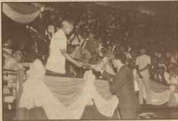
นายกฯ มอบโล่ขอบคุณแก่ ผู้แทนบริษัทกลอสเตอร์เบียร์

3 พฤศจิกายน 2528 ณ อินดอร์สเตเดียม หัวหมาก