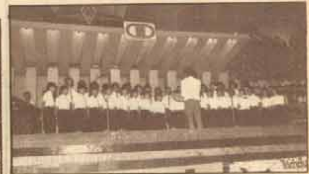
ชมรมขับร้องประสานเสียง