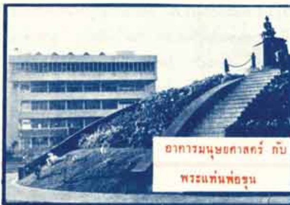
อาคารมนุษยศาสตร์ กับ พระแท่นพ่อขุน

จากสภาพที่เราเคยเรียกร้องเอาโน้นเอานี้ ให้ ได้ดังใจ มาเป็นสภาพของผู้ที่แบ่งแรงงานและแรงใจให้ แก่ผู้ที่เดือดร้อนกว่า จากสภาพที่เราเคยกล่าวโทษคน อื่นเมื่อมีเหตุเกิดขึ้น ทั้ง ๆ ที่เราก่อเหตุเอง มาเป็น สภาพของผู้ยอมรับผิดชอบแล้วแก้ไขตนเอง และรู้จักให้อภัย เมื่อผู้อื่นทำผิดแล้วให้ โอกาสเขาแก้ตัวใหม่