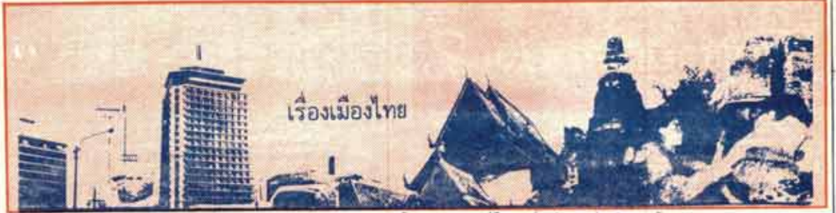
ขอเชิญชมและนักศึกษาม.ร. ทุกท่านร่วมเขียนบทความสั้น ๆ มาลงคอลัมน์นี้ โดยมีจุดมุ่งหมายส่งเสริมความรู้รอบตัว ทุก ๆ ด้านเกี่ยวกับเมืองไทย ทั้งชีวิตประจำวัน ชาติ เศรษฐกิจ ประวัติศาสตร์ ภูมิศาสตร์ ฯลฯ ตลอดจนเกร็ดความรู้อื่น ๆ ที่น่าสนใจและเจ๋งๆ ได้

ส่วนอุปกรณ์ในการประกอบนิทรรศการส่วนใหญ่ มักเป็นภาพเขียนหรือภาพถ่ายหลายสมัย รวมกันตลอดทั้งการแต่งกายของผู้เชื้อเชิญแนะนำก็พยายามแต่งให้เข้ากับบรรยากาศของประเทศนั้น ๆ ที่เห็นได้ชัดเช่น ห้องแสดงประเทศญี่ปุ่น อินเดียและมาเลเซียเป็นต้น นอกจากนี้ก็เป็นชิ้นวัตถุต่าง ๆ บางชิ้นก็เป็นวัตถุโบราณจำลองจากของจริงอันเป็นสัญลักษณ์ประจำชาติมาตั้งแสดงไว้ด้วย เพื่อเป็นเครื่องช่วยคลบบรรยากาศให้มากยิ่งขึ้น ในห้องนิทรรศการประเทศ