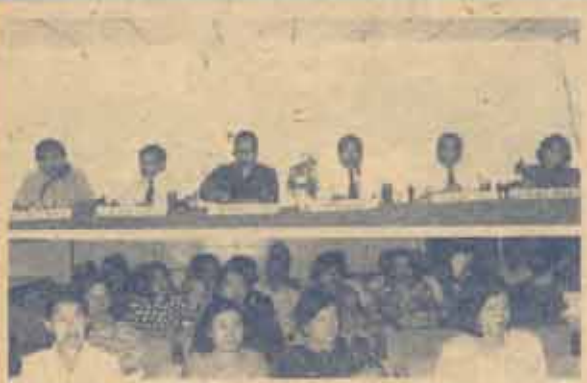
ประชุมการสนทนา รศ. รัษฎรงค์ แสงสุข อธิการบดี มหาวิทยาลัยรามคำแหงเป็นประธานในการประชุมซึ่งวางรายละเอียดเกี่ยวกับข้อปฏิบัติในการสอบซ่อม เมื่อวันที่ 23 สิงหาคม 2537 ณ สภาอาจารย์