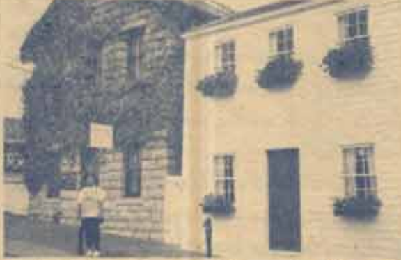
ของที่ระลึกเด็ก ๆ น้อย ๆ เกี่ยวกับทเวน เช่น ที่ค้นหนังสือรูปโปสเตอร์ และโปสการ์ด จำหน่ายด้วย