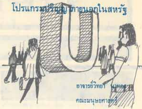
อาจารย์วิชา นวัตกรรม คณะมนุษยศาสตร์

ต่างกันอย่างมาก เช่นที่ UWW มีนักศึกษาอายุระหว่าง ๑๕ ปี ถึง ๗๑ ปี ที่ Skidmore จากจำนวนผู้สมัครเข้าเรียน ๗๒ คน เป็นภาวโรงที่เกษียณอายุแล้ว ๑ คน เป็นผู้คงแก่เรียนซึ่งเขียนหนังสือไว้ ๒ เล่ม ๑ คน เป็นนักโทษที่พ้นโทษแล้ว ๑ คน และอีกคนหนึ่งเป็นนักธุรกิจที่พบความสำเร็จแล้วเป็นอย่างดี แต่ต้องการจะเป็นครูสอนดนตรี นอกนั้นก็เป็นคนสูงอายุ ซึ่งเคยเรียนชั้นปริญญาตรีมาก่อน แต่ไม่ทันจบด้วยเหตุใด ๆ ก็ตาม เข้ามาศึกษาเพื่อให้จบ และเป็นคนหนุ่ม สาว ที่ต้องการหนีจากความเข้มงวดกวดขันของการเรียนตามหลักสูตรแบบเก่า