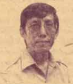
ร.ส.บัณฑิต ก้าวชีวิตท์

อ.สมพงษ์ วิธีเรียนที่จะให้เกิดผลดี เนื่องจากวิชา อุดมศึกษามีความเกี่ยวข้องกับวิชาวิทยาศาสตร์เป็นส่วนใหญ่ ดังนั้นจะมีคำนิยามและกฎต่างๆ ของวิชาฟิสิกส์เข้ามาเกี่ยวข้องด้วย สำหรับผู้ที่พื้นฐานทางวิทยาศาสตร์น้อยก็ควรที่จะเข้าชั้นเรียน และในกรณีที่ไม่เข้าใจที่มาของพื้นฐานทางวิทยาศาสตร์เหล่านั้นก็สามารถตามอาจารย์ผู้สอนได้ อย่างไรก็ตามสำหรับผู้ที่มีภาระไม่สามารถเข้าชั้นเรียนได้ก็ควรที่จะอ่านตำราอย่างละเอียด และพยายามทำความเข้าใจอย่างช้า ๆ ไปด้วย ไม่ควรอ่านไปอย่างผ่านไป เพราะวิทยาศาสตร์นั้นเป็นเรื่องที่ค่อนข้างจะต้องทำความเข้าใจให้ได้