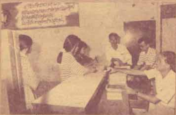
จำหน่ายใบสมัคร มหาวิทยาลัยรามคำแหงจำหน่ายใบสมัครนักศึกษาใหม่ ภาค 1/2533 ตั้งแต่วันที่ 2 เมษายน 2533 เป็นต้นมา โดยจำหน่ายใบสมัครประเภทสมัครด้วยตนเองที่ อาคาร สวป. (หน้า) และจำหน่ายใบสมัครประเภทสมัครทางไปรษณีย์ที่ สวป. ชั้น 5