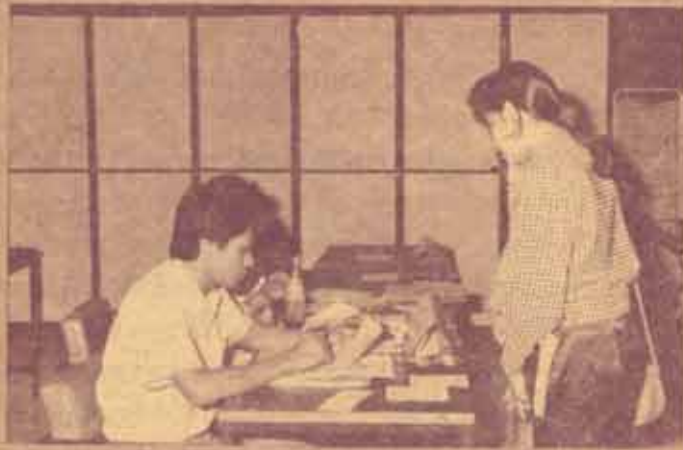
รับนักศึกษาปริญญาโท มหาวิทยาลัยรามคำแหง เปิดรับนักศึกษาปริญญาโท ภาค 1/2533 จำนวน 4 สาขา (รัฐศาสตร์ เศรษฐศาสตร์ เคมีประยุกต์ และภูมิศาสตร์) ระหว่างวันที่ 19-21 เมษายน 2533 ณ ห้องประชุม ชั้น 5 สวป.