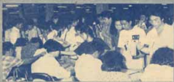
ลงทะเบียนสอบซ่อม มหาวิทยาลัยรามคำแหงลงทะเบียนสอบซ่อมหมวด 2 และภาคฤดูร้อน 1, 2 ปีการศึกษา 2532 ระหว่างวันที่ 9-11 สิงหาคม 2533 ณ รามคำแหง 1 โดยกำหนดการสอบซ่อมระหว่างวันที่ 8-14 กันยายน 2533