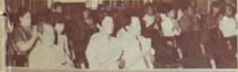
ที่ประชุมปีใหม่ คณะนิติศาสตร์ ม.ร. วิทยุเสียงพระ ในโอกาสวันปีใหม่ 2529 เมื่อวันที่ 30 ธันวาคม ที่ผ่านมา ณ ห้องประชุม คณะนิติศาสตร์ ชั้น 3