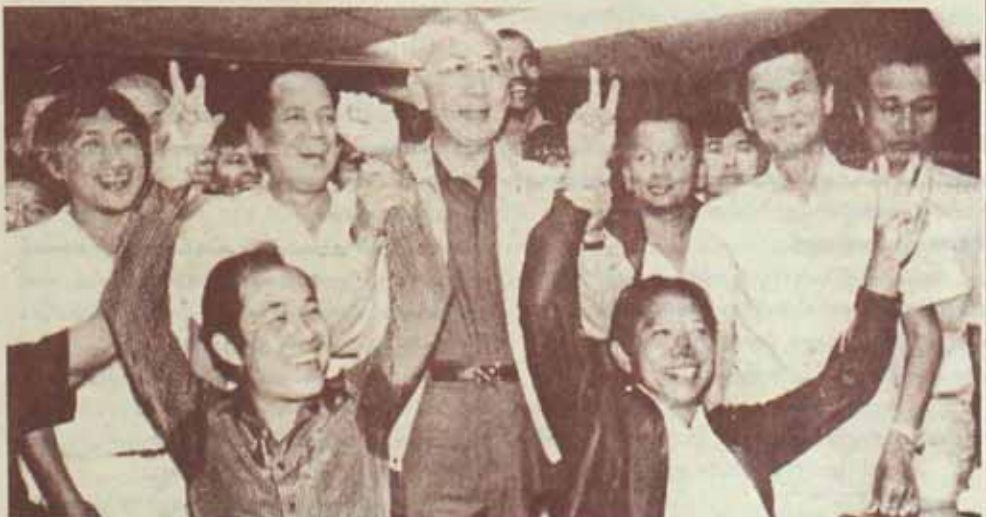
ผลการเลือกตั้งซ่อมส.ส.เขตเลือกตั้งที่ 1

4. พฤติกรรมการใช้สิทธิออกเสียงเลือกตั้งของประชาชนในกรุงเทพมหานคร นับแต่อดีตที่มีการเลือกตั้งไม่ว่าในระดับชาติ