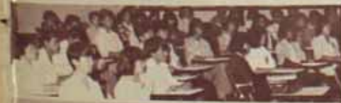
ปฐมนิเทศ คณะกรรมการดำเนินการพัฒนาและฝึกอบรม บุคลากร ม.ร. และงานฝึกอบรม กองการเจ้าหน้าที่ ดำเนิน การปฐมนิเทศบุคลากรใหม่ก่อนมหาวิทยาลัย จำนวน 60 คน เมื่อวันที่ 27 - 28 ธันวาคม 2528 ณ ห้องประชุมประมวล กุลมณี และศูนย์ส่งเสริมและฝึกอบรมการเกษตรแห่งชาติ มหาวิทยาลัยเกษตรศาสตร์ วันพฤหัสบดี 27 ธันวาคม 2528