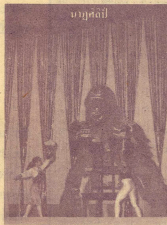
นาฏศิลป์