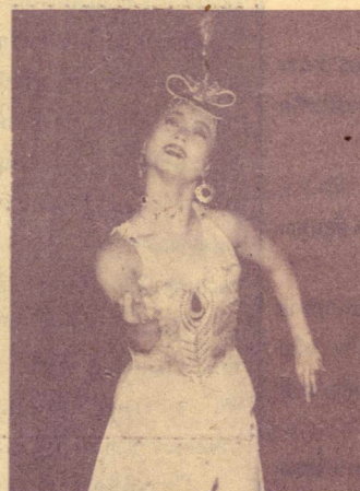
ชุดมยุรีสีทอง