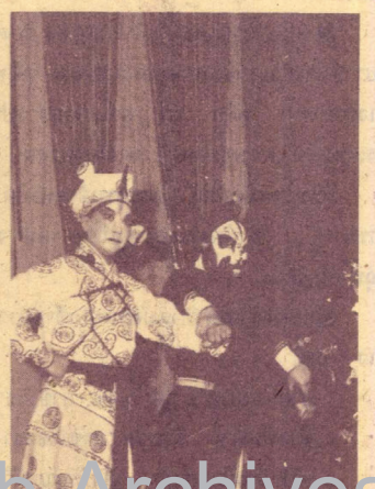
ทางสามแพร่ง