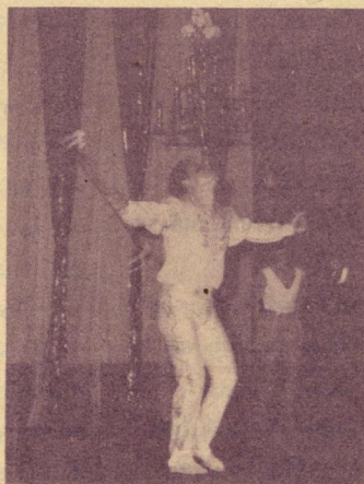
ชุดทูนชัย