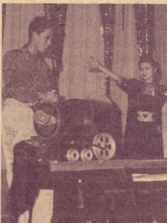
มายากลชุดใหญ่