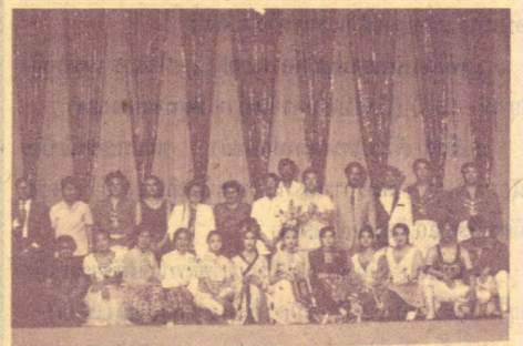
31 พ.ค. 34 อธิการบดี ม.ร. เป็นประธาน