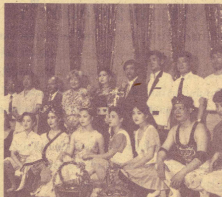
30 พ.ค. 34 บ.ครอลิตี้ คัลเลอร์ จำกัด เป็นประธาน