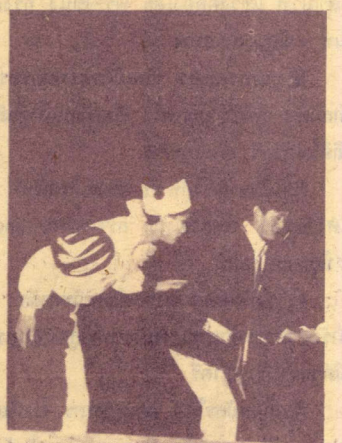
ตลกคันร่ายการ