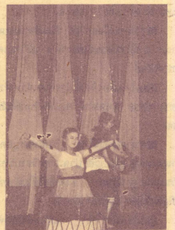
ชุดระบำทวารวดี