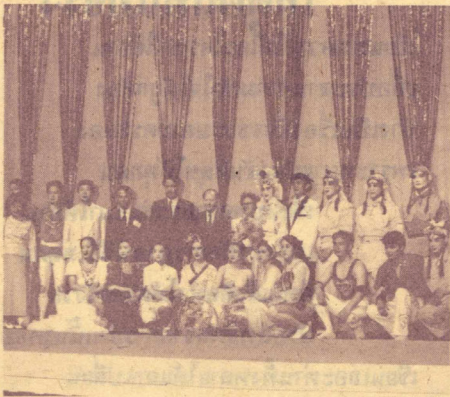
29 พ.ค. 34 บ.เครื่องเจริญโภคภัณฑ์ จำกัด เป็นประธาน