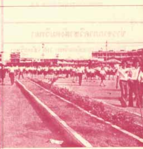
ตอนเข้าที่หน้าประตูทางเข้า ม.ร.