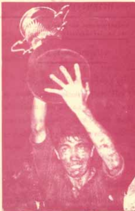
ทีม ม.ร. ชนะเลิศรักบอดมศึกษา ประเภทแพ็คค็อก 2517

สนามทุกเวลาคือโคกระบ่มักก้องด้วยเสียงโห่ร้องแสดงความดีใจของเหล่าก๊อกลงจำนวนหนึ่งที่ได้เข้าไปเชียร์และให้กำลังใจแก่ทีมหวากบี ม.ร. ที โค้ชเชริงชนะเลิศรักบอดมศึกษาประเภท แพ็คค็อก เมื่อวันที่ 15 ส.ค. 17 ผลการแข่งขันปรากฏว่า ทีมรักบี้ "สูกพุดซุม" สามารถพิชิต "สูกสิเชียว" ได้ก็อีกครึ่งหนึ่งด้วยคะแนน 7 ต่อ 6 จุด (1 พอยท์ 1 โทช ต่อ 2 โทช) นับว่าเป็นความสำเร็จอันยิ่งใหญ่เหนือความยิ่งใหญ่เป็นประวัติการณ์ในวงการรักบี้เมืองไทย เนื่องจากนับวันรักบี้ ม.ร. สามารถพิชิตตำแหน่งชนะเลิศได้ 4 ประเภทคือรักบี้ คือ ชนะเลิศรักบี้ประเภท 10 คน 2 คน 2 คน ชนะเลิศรักบี้บอดมศึกษาประเภทแพ็คค็อก และชนะเลิศประเภทบอดมศึกษา 1 ข่าวรามคำแหงขอแสดงความยินดีและขอแสดงความยินดีกับทุกคนที่โผล่ร่วมเชียร์เชียร์กันเองเครื่องโกร และเกริกเสียงเชียร์ร่วมหัวเราะอย่างอันเป็นที่รักของเรว ภาพและข่าวโดย สวไรช ภูวิภาควรรณม วัชรประธานขุนทดถ่ายภาพ ม.ร.