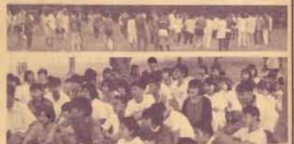
กฎหมายสัมพันธ์'29 เมื่อวันที่ 5-7 กันยายน 2529 กลุ่มกฎหมาย น.ร. ได้จัดงานกฎหมายสัมพันธ์ ประจำปี 2529 ณ น้าคบเอราวัณ จังหวัดกาญจนบุรี โดยมีนักศึกษาเข้าร่วม งานจำนวน 120 คน การจัดงานครั้งนี้มีวัตถุประสงค์เพื่อ สร้างความเข้าใจในการทำกิจกรรมร่วมกัน และปลูกฝัง ความ รักใคร่ไม่ว่าแก่ศิษย์เก่าหรือศิษย์ปัจจุบัน