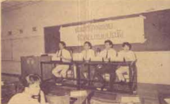
แนะนำ คณะนิติศาสตร์ ม.ร. จัดการอภิปรายทางวิชาการ เรื่อง "แนะนำการตอบข้อสอบแบบปรนัย" แก่ นักศึกษาใหม่ที่รามคำแหง 2 เมื่อวันที่ 22 กันยายน 2529 ณ อาคารพระบาง