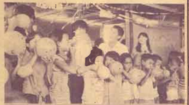
ครูสอน เมื่อวันที่ 23 สิงหาคม - 27 กันยายน 2529 ชมรมศึกษาปัญหาแห่งเดือนโทรม จัดโครงการงาน ครูสอน ที่ ชุมชนแออัดบางนา โดยมีวัตถุประสงค์เพื่อนำนักศึกษาผู้ สนใจลงไปสัมผัสกับปัญหาสังคม ซึ่งนำไปสู่การบำเพ็ญ ประโยชน์ต่อสังคม และเตรียมเปิดโครงการนี้อีกในภาค 2/2529