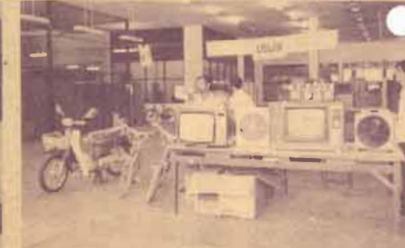
รางวัลภาษา คณะกรรมการจัดงานภาษา ม.ร. ปี 2529 ดำเนินการขายทอดตลาดของรางวัลที่เหลือจากงานภาษา เมื่อวันที่ 15 กันยายน 2529 ณ อาคาร สวป.เก่า จำนวน 6 รายการ เป็นเงิน 18,880 บาท เพื่อนำไปสมทบทุนสภาภาษาไทย ในนามมหาวิทยาลัยรามคำแหงต่อไป

ข่าวจากภาควิชาการโฆษณา ภาคโฆษณา จะจัดสอบวิชา AD 40 5 ในวันเสาร์ที่ 4 ตุลาคม 2529 เวลา 9.00 - 11.30 น. ณ ห้องปฏิบัติการ คณะ บริหารธุรกิจ ลดาวัลย์ ยมจินดา