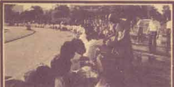
ทำบุญตักบาตร ชมรมพุทธศาสตร์และวัฒนธรรมไทย ม.ร. จัดโครงการทำบุญตักบาตร ทุกวันพฤหัสบดี เวลา 07.00 น. ณ บริเวณสถานพ่อนุ่นฯ โดยนิมนต์พระภิกษุ จาก วัดพระธรรมกาย จังหวัดปทุมธานี จำนวน 60 รูป มารับ บิณฑบาตร ที่เห็นในภาพ เป็นการทำความดีถวายเป็นกุศล ทำก่อนการสอบไล่ ภาค 1/2529

ลักษณะข้อสอบนี้เป็นการทดสอบการเขียนภาษาอังกฤษระดับสูง เวลาที่ทำการสอบ คือ 2.30 นาที ดังนั้นนักศึกษาจะต้องมีความสามารถในการเขียนอย่างคล่องแคล่ว ไม่ติดขัดในเรื่องโครงสร้างทางไวยากรณ์หรือการใช้คำศัพท์อย่างถูกต้อง ดังนั้นในระหว่างการฝึก นักศึกษาจึงควรฝึกหัดทำแบบฝึกหัดตามที่อาจารย์มอบหมายให้ และฝึกหัดทักษะการเขียน (Writing skill) จนสามารถเขียนได้อย่างชำนาญด้วยภาษาที่ราบรื่นได้เนื้อความถูกต้อง ตามหลักไวยากรณ์ภาษาอังกฤษ สำหรับนักศึกษาที่ไม่สามารถมาเข้าชั้นเรียนปกติได้ สามารถติดต่อโดยทางจดหมายสอบถามรายละเอียดเกี่ยวกับลักษณะเนื้อหาวิชาและแบบฝึกหัดที่อาจารย์ผู้สอนกระบวนวิชา EN 40 2 ได้ทุกท่าน