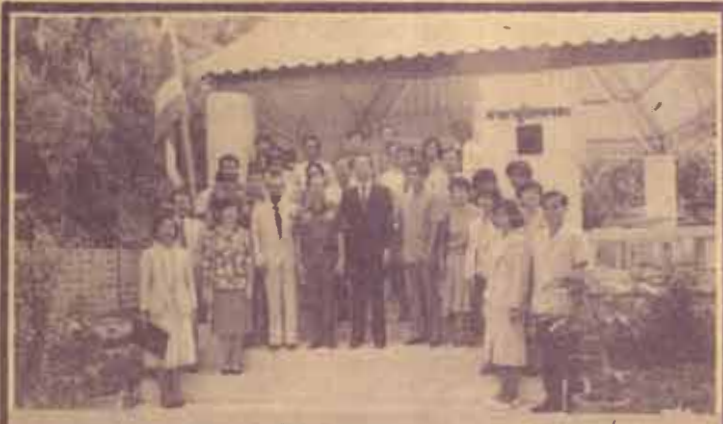
รับมอบ พณฯ รัฐมนตรีว่าการทบวงมหาวิทยาลัย นายสุบิน ปิ่นขันธ์ เป็นประธานในพิธีรับมอบ ศาลาผู้ปกครอง รั้วซีเมนต์ และโรงพลศึกษา ของโรงเรียนสาธิตมหาวิทยาลัยรามคำแหง เมื่อวันที่ 19 กันยายน 2529 ซึ่งงานก่อสร้างดังกล่าว ชมรมผู้ปกครอง-ครู โรงเรียนสาธิตมหาวิทยาลัยรามคำแหง ได้ดำเนินการก่อสร้างเพื่อประโยชน์ในกิจการของโรงเรียนฯ

คณะรัฐศาสตร์ ม.ร. จะจัดการแข่งขันโบว์ลิงการกุศล เพื่อหารายได้สมทบทุนของคณะฯ ในด้านกิจกรรมทางวิชาการและสวัสดิการ ในวันอาทิตย์ที่ 5 ตุลาคม 2529 เวลา 09.30 น. เป็นต้นไป ณ สโมสรโบว์ลิงถนนเพชรบุรีตัดใหม่ การแข่งขันครั้งนี้ มีทั้งประเภททีม และประเภทบุคคลชิงถ้วยรางวัลของ รัฐมนตรีว่าการกระทรวงยุติธรรม (นายสะอาด ปิยวรรณ) อ่านต่อหน้า 12