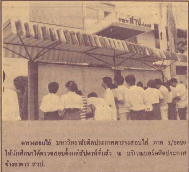
ตารางสอบไล่ มหาวิทยาลัยคิดประกาศตารางสอบไล่ ภาค 1/2529 ให้นักศึกษาได้ตรวจสอบตั้งแต่สัปดาห์ที่แล้ว ณ บริเวณอาคารคิดประกาศข้างอาคาร สวป.