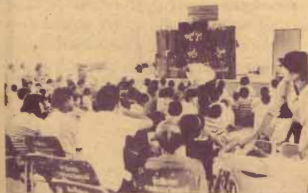
นิทรรศการอ่าน สำนักหอสมุดกลาง ม.ร. จัดกิจกรรม เพื่อส่งเสริมและสร้างนิสัยรักการอ่านแก่เด็กพิการและ ทูพพลภาพ ณ สถานสงเคราะห์เด็กพิการ และทูพพลภาพ ปากเกร็ด เมื่อวันที่ 19 กันยายน 2529 กิจกรรมดังกล่าว เป็นบริการทางวิชาการแก่ชุมชนของสำนักหอสมุดกลาง ม.ร.