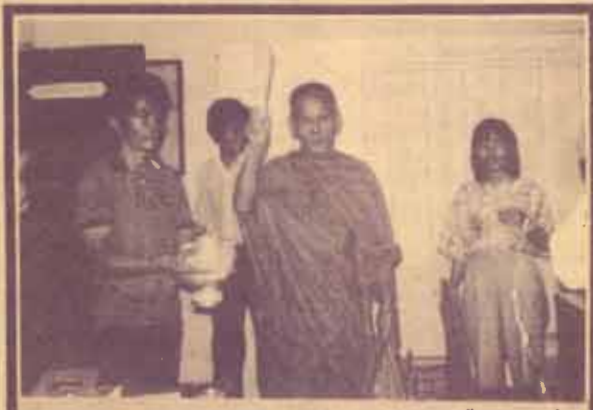
ทำบุญ พนักงานโรงพิมพ์ ม.ร. ทำบุญเลี้ยงพระเพื่อ ความเป็นสิริมงคล เมื่อวันที่ 13 กันยายน 2529 ณ ที่ทำ การโรงพิมพ์ ม.ร.