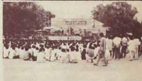
14 ปีราศ์พหุอง องค์กรนักศึกษามหาวิทยาลัยรามคำแหง จัดรายการ 14 ปีรามคำแหง เพื่อฉลองวันสถาปนามหาวิทยาลัย เมื่อวันที่ 28 พฤศจิกายน 2528 ณ บริเวณลานสาว. โดยมีการอภิปราย และดนตรี