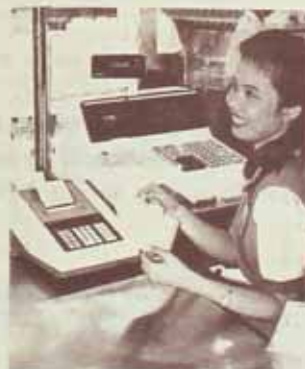
ธนาคารออกใบอับให้ 3 ฉบับ