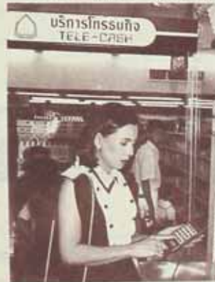
กรรหัดอับของนักศึกษ