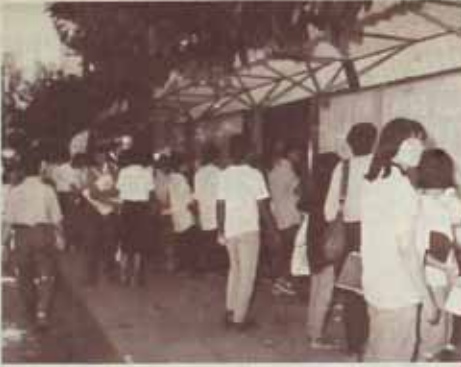
ตรวจดูรายชื่อ ตั้งแต่ต้นเดือนธันวาคม ที่ผ่านมามีบัณฑิตมหาวิทยาลัยรามคำแหง รุ่น 11 ซึ่งจะเข้ารับพระราชทานปริญญาบัตรในวันที่ 18 - 24 ธันวาคม 2528 ได้มาตรวจดูรายชื่อและกำหนดวันรับ ณ อนุสรณ์สถานของสภา.