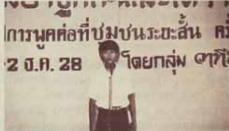
พิศุต ขวมนป้าอุตาและได้ว่าที่ จัดอบรมคือปล การพูดต่อที่บ่มบ่มระชะสั้น ครั้งที่ 3 ประจำปี 2528 เมื่อวันที่ 28 พฤศจิกายน - 2 ธันวาคม 2528 ณ ห้อง 301 อาคารที่ทำการคณะศึกษาศาสตร์