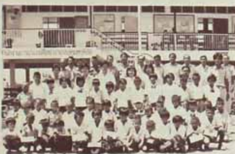
มอบทุนการศึกษาแก่เด็กนักเรียนในจังหวัดศรีสะเกษ

คณะกรรมการบัณฑิตรุ่นที่ 10 ได้ดำเนินการต่าง ๆ ตั้งแต่พิธีรับพระราชทานปริญญาบัตรมาจนถึงปัจจุบันนี้ได้เสร็จสิ้นตามเป้าหมายทุกประการ ดังนั้น ทางคณะกรรมการจึงได้สรุปผลงานที่ได้ทำไปเพื่อให้ทางมหาวิทยาลัย เพื่อนบัณฑิต ตลอดจนเพื่อนนักศึกษาได้ทราบ