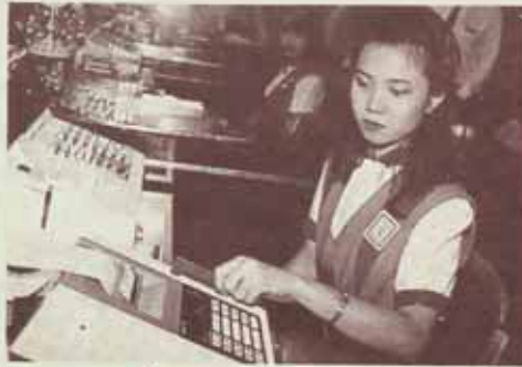
อับพักร A.T.M. ไฟฟ้าทักที่