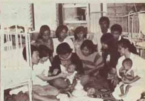
มอบทุนให้มูลนิธิ และเนื่องอาหารเด็ก หมู่บ้านทศวัน

คณะกรรมการบัณฑิตรุ่นที่ 10 ได้ดำเนินการต่าง ๆ ตั้งแต่พิธีรับพระราชทานปริญญาบัตรมาจนถึงปัจจุบันนี้ได้เสร็จสิ้นตามเป้าหมายทุกประการ ดังนั้น ทางคณะกรรมการจึงได้สรุปผลงานที่ได้ทำไปเพื่อให้ทางมหาวิทยาลัย เพื่อนบัณฑิต ตลอดจนเพื่อนนักศึกษาได้ทราบ