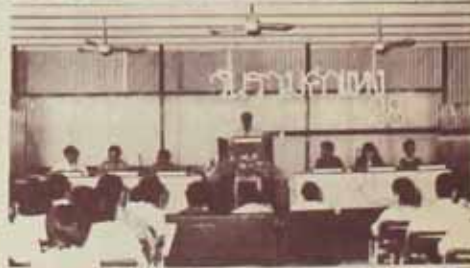
แชรววตี การแชรววตี เรื่อง "เยาวชนไทยหัวใสใ้คู่เฟ่ง" ในงาน "วันรามคำแหง 28" เมื่อวันที่ 27 พฤศจิกายน 2528 ณ ห้องประชุมคณะนิติศาสตร์ ชั้น 3

งานที่เสียสละและมีประสิทธิภพในการทำงานเคลื่อนไหวมวลชนเป็นอย่างไร ขณะที่ตัวกันการพัฒนาเศรษฐกิจ-สังคมให้ทันสมัยอันสมัยของพลสฤษดิ์ และจอมพลถนอม มีผลให้เกิดปัญญาชนกลุ่มใหม่ขึ้น โดยเฉพาะในแวดวงมหาวิทยาลัย นักศึกษาเริ่มตื่นตัวทางการเมืองด้วยปัจจัยการเปลี่ยนแปลงจากภายนอกประเทศ เช่น การต่อต้านสงครามเวียดนาม และปัจจัยภายในประเทศที่นักศึกษาวิพากษ์การปกครองด้วยรัฐบาลเผด็จการทหารผูกขาดอำนาจทางการเมืองและสังคมมานาน และกำหนดนโยบายไม่เป็นอิสระแต่ตามคำแนะนำของอเมริกา จนถึงกับยินยอมให้อเมริกาตั้งฐานทัพในประเทศหลายแห่งเพื่อใช้ข่มขู่เวียดนาม