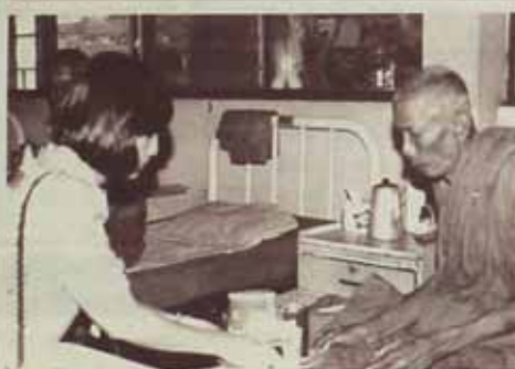
ฉายาสังฆมและเบิขัติที่โรงพยาบาลสงฆ์