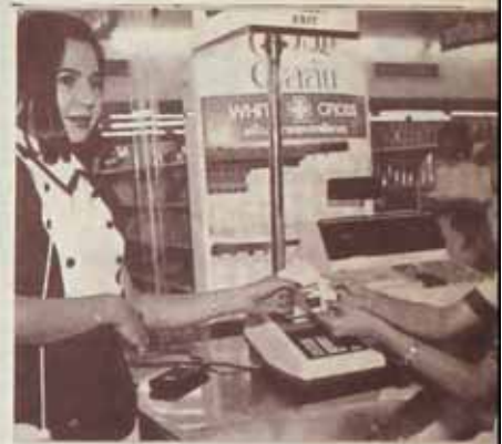
เก็บอับเป็นหลักฐานและรับบัตร A.T.M. คืน