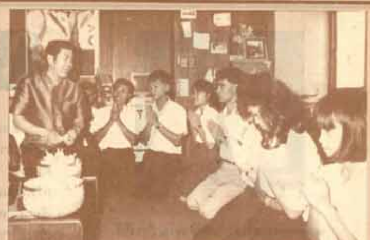
รดน้ำ-คำหัว ชมรมพุทธศาสตร์และวัฒนธรรมไทย รดน้ำ- คำหัว ศาสตราจารย์ ดร.ธรรมบุญ ไสถาวรรัตน์ อธิการบดีมหาวิทยาลัยรามคำแหง ตามประเพณีสงกรานต์ เมื่อวันที่ 14 เมษายน 2532 ณ สำนักงานอธิการบดี ชั้น 5