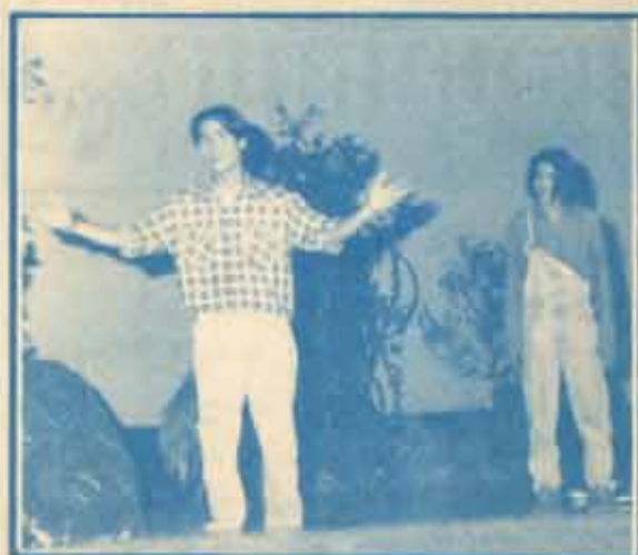
ละครไอ้เพื่อนยาก ชมรมศิลปะและการแสดง น.ว. จัดแสดงละครเวทีสะท้อนชีวิตจริงโดยได้ดัดแปลงบทประพันธ์จากนวนิยายร่วมสมัยเรื่อง 'ไอ้เพื่อนยาก' (OF MICE AND MEN) ซึ่งได้รับรางวัลโนเบล สาขาวรรณกรรมชาวอเมริกัน ปี 1962 ณ หอประชุมใหญ่ AD 1 ระหว่างวันที่ 27-28 เมษายน 2537

เมื่อวันที่ 26-28 เมษายน 2537 มีการเลือกตั้งเสรีที่เปิดโอกาสให้คนทุกสีผิวและทุกเชื้อชาติเข้ามามีส่วนร่วมในการลงคะแนนเสียงเป็นครั้งแรกในประวัติศาสตร์