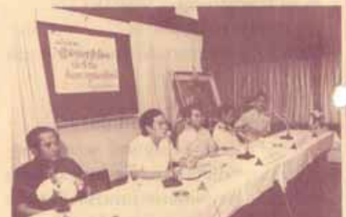
อภิปราย ฝ่ายกิจกรรมนักศึกษา สภาอาจารย์ จัด นิทรรศการการศึกษานานาชาติ "การเมืองไทย อดีต - ปัจจุบัน - อนาคต" เมื่อวันที่ 9 - 10 เมษายน 2530 ณ ห้องประชุม คณะรัฐศาสตร์ มหาวิทยาลัยราชภัฏวชิรเวศน์ เมื่อวันที่ 18 เมษายน ๒๕๓๐