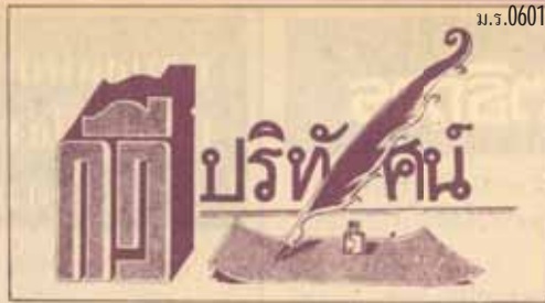
เมื่อเชกกล้าฝัน

ด้วยรักและเชื่อมั่นต่อทุกคน รหัส 26252494