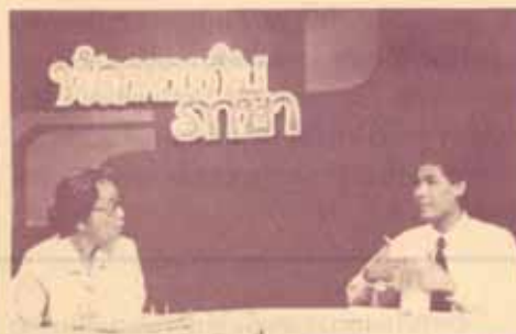
นัดพบกันภายใน โรงเรียน วิทยาลัยเกษตรกรรม ๙ ตุลาคม อินทนา อุตสาหกรรม ในงาน B ๒๐๐๑ 11 เว ย ๑๑ เมษายน ๒๕ "นัดพบกันภายใน" (๒๐๐๑) ๑๑ เมษายน ๒๕๓๐ เมื่อวันที่ 18 เมษายน ๒๕๓๐