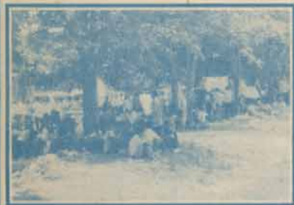
ห้องใหม่ '40