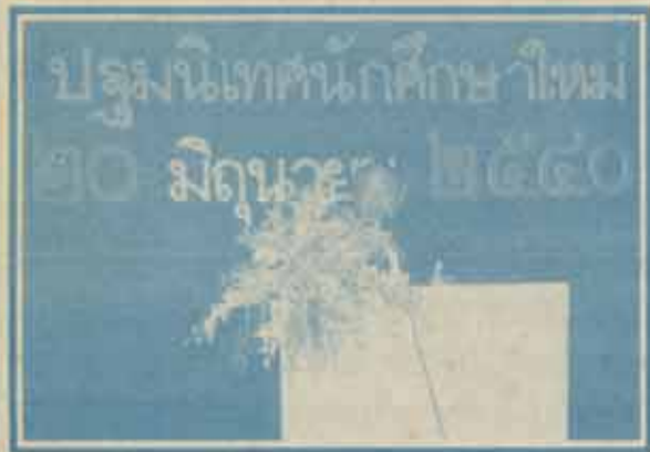
อธิการบดีกล่าวต้อนรับและให้โอวาทแก่นักศึกษาใหม่

ปีการศึกษา 2540 ณ รามคำแหง 2 วิทยาเขตบางนา