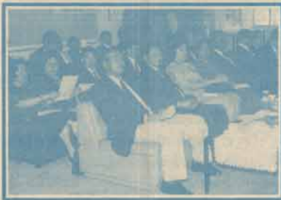
คณะผู้บริหารมากันพร้อมหน้า