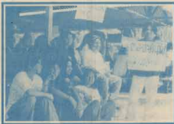
รุ่นที่มาต้อนรับห้องใหม่ตามซุ้มต่าง ๆ