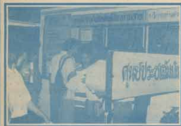
ศูนย์ประชาสัมพันธ์รามฯ๒ ให้บริการประกาศข่าวสาร ตลอดทั้งวัน ตั้งแต่เช้า-เย็น