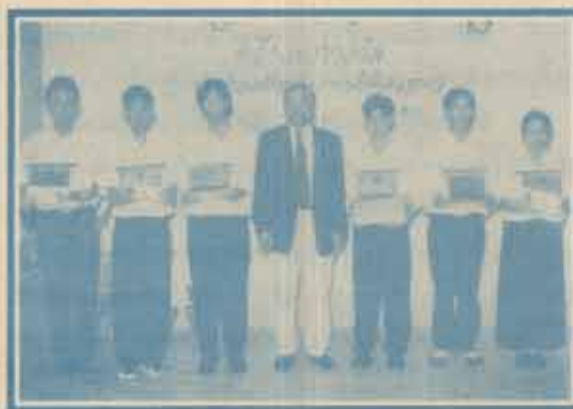
ส่วนหนึ่งของผู้ที่ได้รับรางวัลประกวดคำขวัญ "เพื่อนเรา....เพื่อนรามฯ"