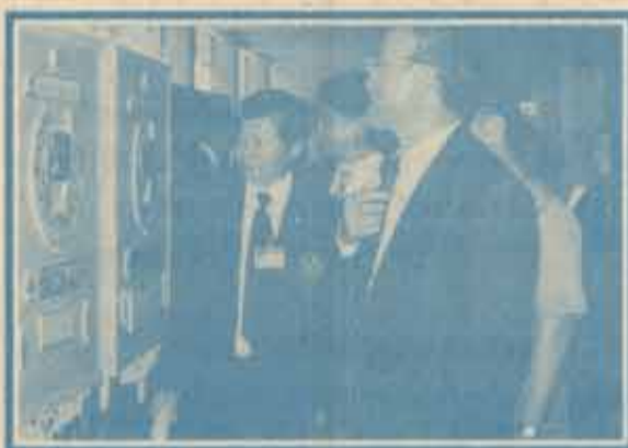
คณะผู้บริหารเดินชมบอร์ดนิทรรศการ