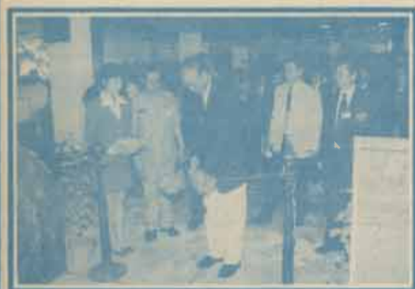
อธิการบดีเป็นประธานเปิดนิทรรศการ