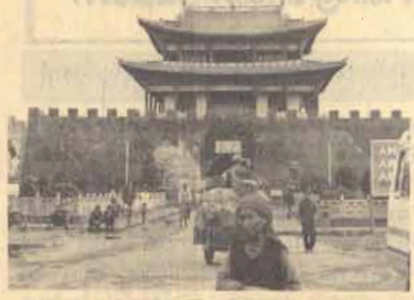
ประตูเมืองต้าหลี่

วันที่ 21-23 กรกฎาคม 1986 คณะเราได้พักที่เมืองต้าหลี่ ต้าหลี่เป็นเมืองที่ไม่ใหญ่นัก เราเจอพบเห็นผู้คนแต่งกายสีสรรที่ไม่แตกต่างกันคือชุดสีน้ำเงินหรือชุดสีเทา ที่เห็นส่วนใหญ่ทั่วไปดูจะแตกต่างกับที่ปักกิ่ง มากในเรื่องการแต่งกายที่ต้าหลี่ชนพื้นเมืองส่วนใหญ่เป็นชนชาติไป มีวัฒนธรรมประเพณี เอกลักษณ์ของตนเองโดยเฉพาะ ที่ต้าหลี่นี้คณะเราได้สัมมนากับนักวิชาการของต้าหลี่เกี่ยวกับอาณาจักรน่านเจ้า ซึ่งเป็นการสัมมนาที่เกี่ยวข้องกับถิ่นกำเนิดของชนชาติไทย โดยสรุปจากการสัมมนากับนักวิชาการจีน และจากการสังเกต