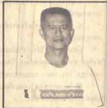
พ.ด.ช.จำลอง ศรีเมือง