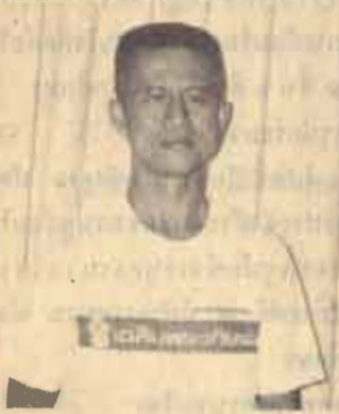
พด.จ.จำลอง ศรีเมือง ผู้ว่า กทม.