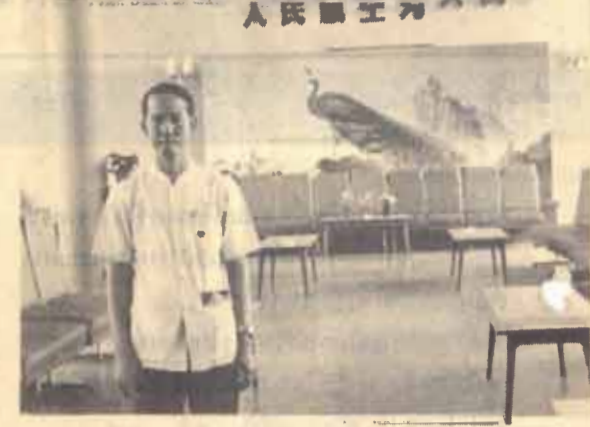
ผู้เขียนที่ห้องรับรองสนามบินเมืองคุนหมิง

การสังเกตทั่วไป พอจะชี้ได้ว่าอาณาจักรน่านเจ้าในอดีตนั้นไม่ได้เป็นถิ่นกำเนิดของชนชาติไทยแต่อย่างใด เพราะชนเผ่าที่ปกครองอาณาจักรน่านเจ้านั้นเป็นชนเผ่าห่อและชนเผ่าไป ซึ่งเป็นชนส่วนใหญ่ของต้าหลี่มาจนถึงปัจจุบัน นอกจากนี้ผู้เขียนก็ได้มีโอกาสไปคูตลาจารึกกูปโลง้าน พิชิตอาณาจักรต้าหลี่ ซึ่งเป็นอาณาจักรที่สืบต่อจากอาณาจักรน่านเจ้า และศิลาจารึกพระเจ้าโก๊ะล่อง ในสมัยอาณาจักรน่านเจ้า ในการทำสงครามกับกษัตริย์ในราชวงศ์ถังของจีน และมีเหตุผลประกอบการศึกษาเรื่องนี้ก็หลายประการ ซึ่งเป็นสิ่งที่มีประโยชน์มากในการศึกษาเกี่ยวกับประวัติศาสตร์ชนชาติไทย หลังการสัมมนา คณะเราได้ต้องเรือชมทะเลสาปเอ้อไห่อันลือชื่อของเมืองต้าหลี่ ซึ่งมีธรรมชาติสวยงามมาก ซึ่งต้องขอขอบคุณสมาคมมิตรภาพจีนและสาขาเมืองต่าง ๆ ที่อำนวยความสะดวกและนำใจ ณ ที่นี้ด้วย