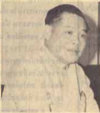
นายบรรหาร ศิลปอาชา รัฐมนตรีว่าการกระทรวงคมนาคม บัณฑิตนิเทศศาสตร์ ม.ร.