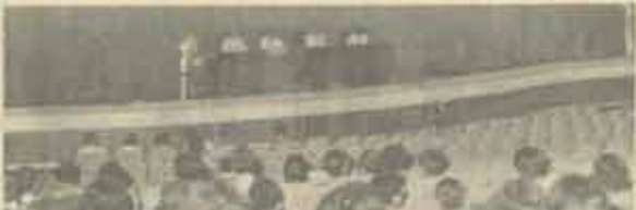
ประชุมสอบไล่ มหาวิทยาลัยรามคำแหงประชุมกรรมการฝ่ายต่าง ๆ ในการสอบไล่ภาค 1/2526 รวมทั้งหัวหน้าศึกษสสอบ ผู้ช่วยหัวหน้าศึกษสสอบ และกรรมการควบคุมการสอบ เพื่อชี้แจงแนวปฏิบัติเกี่ยวกับการสอบไล่ ภาค 1/2526 เมื่อวันที่ 7 ตุลาคม 2526 ณ ห้องประชุม เอ.ศ. 1