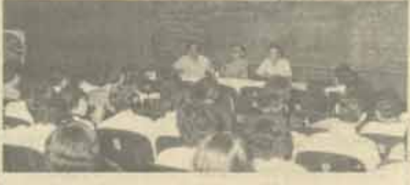
เลือกตั้ง วันสหกรณ์มหาวิทยาลัยรามคำแหง จัดตั้งประชุมสมาชิกเมื่อวันที่ 7 ตุลาคม 2526 ณ ห้องประชุม เอ.ศ. 2 เพื่อเลือกตั้งกรรมการดำเนินงานบริหาร จำนวน 8 ท่าน แทนกรรมการวายุปัจจุบันที่หมดวาระและลาออกไป