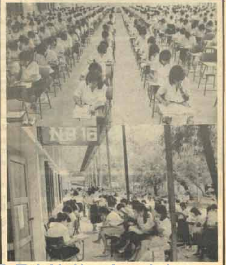
ภาพนี้ มหาวิทยาลัยรามคำแหง เริ่มเปิดได้ 10 ต.ค. 3 หอที่ เป็นที่ ที่สูงในความมืด เพื่อป้องกันความหวง G หรือ P ของทุกคน

มหาวิทยาลัยรามคำแหงจัดส่งนักกีฬาจำนวน 465 คน เข้าร่วมการแข่งขันกีฬามหาวิทยาลัย ครั้งที่ 11 คาดหวังว่าจะสามารถกวาดเหรียญทองได้จากกีฬาเกือบทุกประเภท ระหว่างวันที่ 24-31 ตุลาคม 2526 จุฬาลงกรณ์มหาวิทยาลัย จะเป็นเจ้าภาพการแข่งขันกีฬามหาวิทยาลัย ครั้งที่ 11 โดยมีสถาบันอุดมศึกษา 13 แห่งเข้าร่วมแข่งขัน คือ มหาวิทยาลัยเกษตรศาสตร์ มหาวิทยาลัยศิลปากร มหาวิทยาลัยมหิดล มหาวิทยาลัยธรรมศาสตร์ มหาวิทยาลัยขอนแก่น มหาวิทยาลัยเชียงใหม่ มหาวิทยาลัยบูรพา มหาวิทยาลัยรามคำแหง สถาบันเทคโนโลยีพระจอมเกล้า สถาบันเทคโนโลยีการเกษตร แม่โจ้ สถาบันวิทยาศาสตร์บริหารศาสตร์ มหาวิทยาลัยศรีนครินทรวิโรฒ และจุฬาลงกรณ์มหาวิทยาลัย สำหรับกีฬาที่แข่งขันในครั้งนี้มี ยูโด คาบูกิ คาบสากู มวย วัยนา 19 ประเภทด้วยกัน คือ ฟุตบอล โปโลน้ำ หนักกระดาน เทเบิลเทนนิส บาสเกตบอล วอลเลย์บอล กรีฑา เทนนิส และแบดมินตัน โดยสนามที่ ออกลี อิงปอง ว่ายน้ำ ตะกร้อ ซอฟบอล