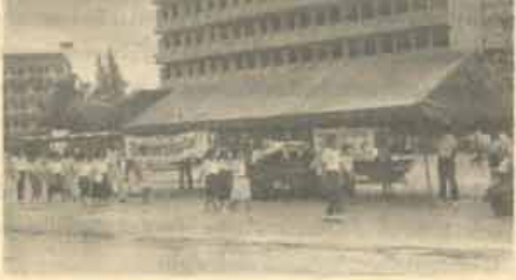
ปัสการสอบ ในการสอบไล่ภาค 1/2526 (10 ค.ค. - 3 พ.ศ. 26) ประชาสัมพันธ์ มหาวิทยาลัยรามคำแหง จัดตั้งเต็นท์ประชาสัมพันธ์การสอบ ณ บริเวณประตูใหญ่หน้ามหาวิทยาลัย เพื่อให้บริการตอบคำถามและคำแนะนำแก่ผู้มาสอบ