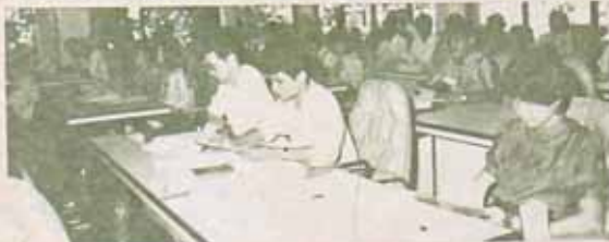
วิทยาการคณิตศาสตร์ ภาควิชาคณิตศาสตร์ คณะวิทยาศาสตร์ มหาวิทยาลัยรามคำแหง ร่วมกับ ศูนย์ส่งเสริมการวิจัยคณิตศาสตร์ สมาคมคณิตศาสตร์แห่งประเทศไทย จัดประชุมวิชาการคณิตศาสตร์ เรื่อง "ตัวแบบทางคณิตศาสตร์กับคอมพิวเตอร์" เมื่อวันที่ 24-25 มีนาคม 2529 ณ ห้องประชุม ๓๐.๓.๓ เพื่อเป็นการบริการทางวิชาการแก่อาจารย์ในสถาบันอุดมศึกษา