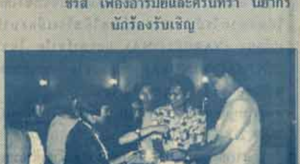
นักข่าวร น้ำเอพรอธิการบดี