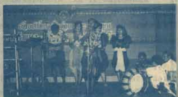
ลำดัดฟรีสไตล์ คณะโธมัส แก้วเขียว