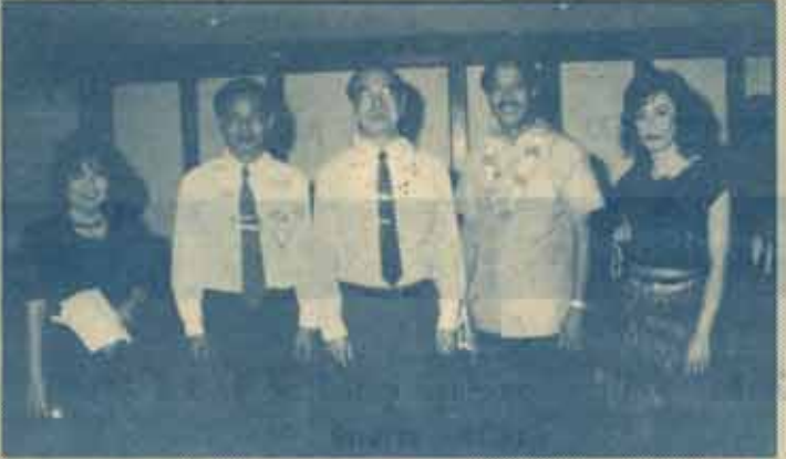
รองอธิบดีกรมประชาสัมพันธ์และผอ.ช่อง 11 ก็มาร่วมงาน