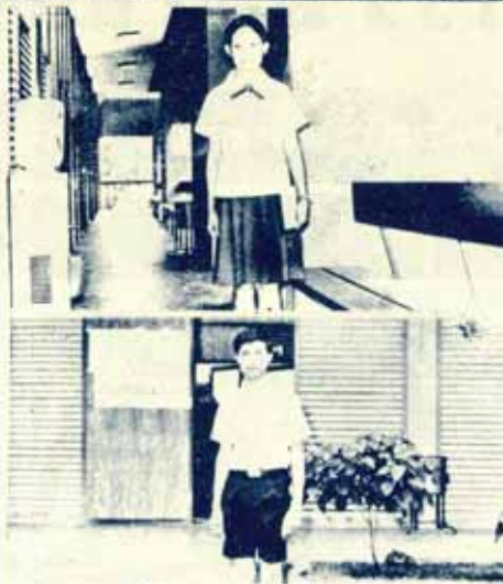
เครื่องแบบมัธยมสตรีตามค่าแห่ง