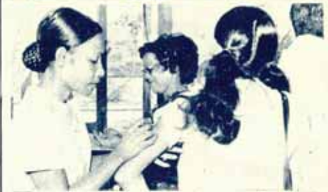
นศ. ม.ร. จัดชยาถูกที่ ๗ แทนทดแทนที่ ม.ร.