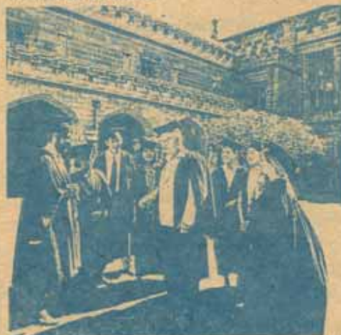
In a university quadrangle

6. อนุปริญญา (Associate Diploma) เป็นการเรียนในหลักสูตร 2 ปี ซึ่งนักศึกษาที่จะเรียนปริญญาตรี จะต้องผ่านขั้นตอนนี้