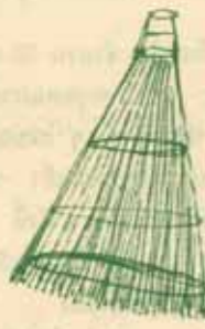
ครอมคัดนก