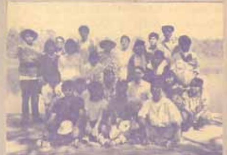
สำรวจข้อมูลฐานเศรษฐกิจและสังคมชุมชน

คณะนักศึกษารัฐศาสตร์ มหาวิทยาลัยรามคำแหง 3 (EC 563) ออกสำรวจข้อมูลพื้นฐานเศรษฐกิจและสังคมของประเทศไทยเป็น ๓ ตำบลของนครหลวง ลำปางเชียงใหม่ เชียงใหม่ ระหว่างวันที่ 1-9 กุมภาพันธ์ 2531