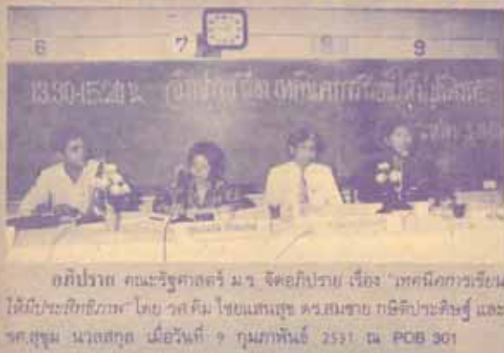
อภิปราย คณะรัฐศาสตร์ ม.ว. จิตวิทยา เรื่อง "เทคนิคการเรียนให้มีประสิทธิภาพ"...