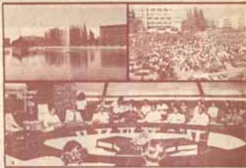
และลงนามเป็นทางการ

ก่อนที่จะได้ตำแหน่ง Assistant ผู้มีคุณวุฒินั้นจะได้รับการเสนอชื่อเข้าในรายชื่อของผู้มีวุฒิถึง (liste d'aptitude) โดยมีคณะกรรมการผู้ทรงคุณวุฒิอื่นประกอบด้วยผู้แทนจากสาขาวิชาการต่าง ๆ เป็นผู้พิจารณาผู้เสนอชื่อ เมื่อคัดเลือกแล้วจะเสนอชื่อต่อสภามหาวิทยาลัยซึ่งจะเป็นผู้เสนอชื่อต่อไปยัง Rector ของ Académie นั้น ส่วนการแต่งตั้งอาจารย์ในระดับสูงขึ้นไปอีกจนถึงขั้นศาสตราจารย์ สภามหาวิทยาลัยจะต้องส่งชื่อผู้ควรได้รับการแต่งตั้งไปยังรัฐมนตรีกระทรวงมหาวิทยาลัยเพื่อได้รับทราบ