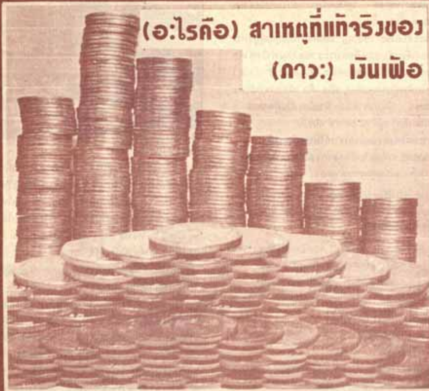
ส.ร.มธ. ลอยเงินเล่า คณะบริหารธุรกิจ

โปรดอย่ารีบที่ทักท้วงผมเอาเรื่อง (ภาวะ) เงินเฟ้อ มาเล่าให้ฟัง (อีก) เดะ เพราะใคร ๆ เขารวบกัน (มานานแล้วละดู) ว่ามันคืออะไรกัน