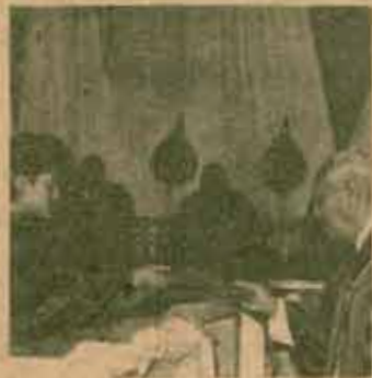
ท.ม.ล.ปิ่น มาลากุล (สาขาภาษาไทย)