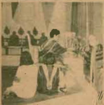
ท.ฉิดดี คิงคภักดิ์ สาขานิติศาสตร์