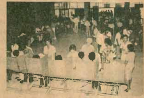
เล็งคัง สหกรณ์ออมทรัพย์และการรณกิจ มหาวิทยาลัยรามคำแหงดำเนินการเลือกตั้ง กรรมการดำเนินงานรุ่นที่ 7 เมื่อวันที่ 12 เมษายน 2527 ณ ห้องประชุม 10.ค.1

เปลี่ยนแปลงรายการวิทยุการศึกษา (ทาง สวท.รายการ 2 ความถี่ 846 กิโลเฮิร์ตซ) วิทยุและโทรทัศน์การศึกษา แจ้งว่า เนื่องจากมีความผิดพลาดในการพิมพ์ตารางอากาศใน มร.30 จึงขอเปลี่ยนแปลงรายการของอากาศสถานีวิทยุกระจายเสียงแห่งประเทศไทย รายการ 2 ความถี่ 846 กิโลเฮิร์ตซ ดังนี้ วันอาทิตย์เวลา 14.00, 14.30 และ 15.00 - 15.30 น. (เดิมวิชา LA 310) วิชาที่ถูกต้องคือ LA 410