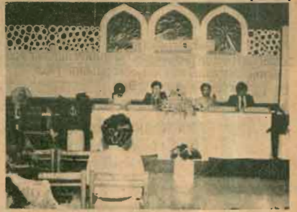
สังคม สำนักหอสมุดกลาง มหาวิทยาลัยรามคำแหง จัดการสัมมนาเรื่อง "แนวทางในการพัฒนาสำนักหอสมุดกลาง มหาวิทยาลัยรามคำแหง" เมื่อวันที่ 12 - 14 เมษายน 2527 ณ สำนักหอสมุดกลาง และจอมเทียนพาเลซ พัทยา