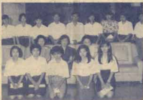
มอบทุนการศึกษา คณะมนุษยศาสตร์ ม.ร. มอบทุนการศึกษา จากมูลนิธิการศึกษาและมนุษยศาสตร์ มหาวิทยาลัยรามคำแหง แก่นักศึกษา เนื่องในวันมนุษยศาสตร์ 2533 เมื่อวันที่ 28 กันยายน 2533 ณ ห้องประชุมคณะ ฯ