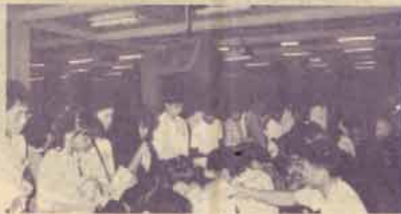
องคมนตรี มหาวิทยาลัยรามคำแหงลงทะเลเบียนเวียนภาคฤดูร้อน/2533 ระหว่างวันที่ 28 มีนาคม - 3 เมษายน 2534 ณ รามคำแหง :

เรื่องการแต่งกายไม่เรียบร้อยนั้น ตามที่มหาวิทยาลัยกำหนดไว้ก็ดีแล้ว แต่ยังไม่บังคับให้แต่งชุดนักศึกษามหาวิทยาลัยก็ควรจะโอนอ่อนผ่อนตามโดยการให้คะแนนมารยาท 5 คะแนนในทุกวิชาของนักศึกษาที่แต่งชุดนักศึกษามาสอบ (หรือมาเรียนตามปกติด้วยจะดีมากกว่า) สำหรับผู้ที่อยู่ในวัยรุ่นตอนปลายหรือผู้มีอายุแล้วควรจะให้ใส่เสื้อสีอื่นได้แต่ต้องไม่มีลายหรือสีอื่น ๆ ปนต้องเป็นผ้าพื้น วิธีนี้อาจจะทำให้นักศึกษาตื่นตัวมาแต่งกายดูภาพเรียบร้อยขึ้น เพราะหวังผลคะแนนที่จะสอบผ่านในวิชาต่าง ๆ วิธีปฏิบัติให้อาจารย์ที่คุมสอบทำเครื่องหมายที่ด้านซ้ายของหัวกระดาษคำตอบของนักศึกษาที่ไม่แต่งชุดนักศึกษา (คิดว่าคงจะมีน้อยกว่าผู้แต่งชุดนักศึกษา) เวลาตรวจคำตอบแล้วไม่มีเครื่องหมายก็จะได้เพิ่ม 5 คะแนน และเห็นสมควรให้ใช้ข้อบังคับเดิมที่ว่าด้านแต่งกายไม่ดูภาพเรียบร้อยไม่มีสิทธิเข้าสอบ วิธีนี้อาจทำให้เกณฑ์วัดผลของมหาวิทยาลัยลดลงไป 5 คะแนน