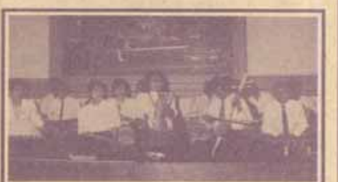
การแสดงของนักศึกษา ม.ร. ในงานเลี้ยงรับรอง