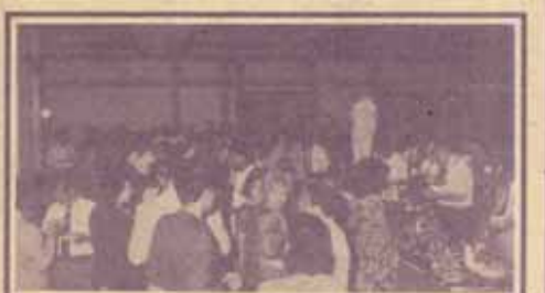
งานเลี้ยงรับรองผู้เข้าร่วมประชุม ณ โรงแรมมังกร