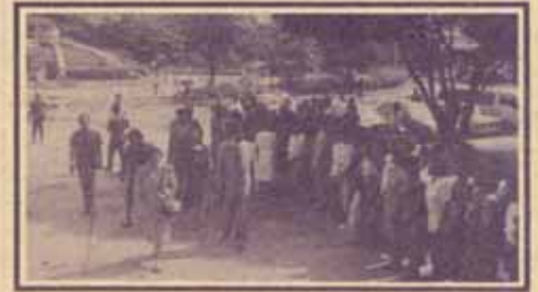
ผู้บริหารมหาวิทยาลัย พร้อมคณาจารย์ ข้าราชการ เจ้าหน้าที่ เฝ้ารับเสด็จฯ