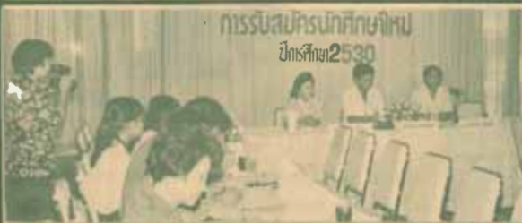
การรับสมัครนักศึกษาใหม่ ปีการศึกษา 2530