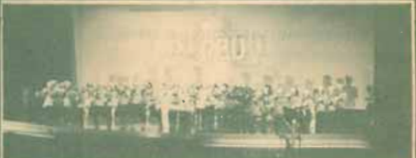
กมลเนติ คณะศึกษาศาสตร์มหาวิทยาลัยอโอซากะ ประเทศญี่ปุ่น จัดงานตามเมืองเอะบะชิได้เปิดการแสดงดนตรี "กมลเนติ Osaka City University" ที่หอประชุม เด.ดี. 1 มหาวิทยาลัยรามคำแหง เมื่อแลกเปลี่ยนวัฒนธรรมและเชื่อมความสัมพันธ์ที่ระหว่งมหาวิทยาลัย ๒ ประเทศ ซึ่งมีผู้สนใจเข้าชมเป็นจำนวนมาก