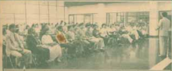
เปิดสอน นักการศึกษา จาก 20 ประเทศทั่วโลก ที่ร่วมประชุม นานาชาติครั้งที่ 2 เรื่อง "นวัตกรรมการและเทคโนโลยีการอุดมศึกษา เปิด" ซึ่งมหาวิทยาลัยรามคำแหงเป็นเจ้าบ้านและผู้รับผิดชอบ ของ ม.ร. เมื่อวันที่ 27 มีนาคม 2530 โดย รศ.สุขุม นวลสกุล อธิการบดี มหาวิทยาลัยรามคำแหง ให้การต้อนรับ ณ ห้องประชุม เอ.ดี. 3 และ นำชมการดำเนินงานของ ฝ่ายต่างๆ สวป. สำนักหอสมุดกลาง และ สำนักเทคโนโลยีการศึกษา