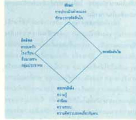
โครงสร้างการตัดสินใจเลือกอาชีพ

ก. ความรู้ ในที่นี้คือรู้ซึ่งข้อเท็จจริง ข้อมูลเกี่ยวกับอาชีพ ความรู้เรื่องรบบประกอบตัว กิจวัตรของงานที่ต้องทำ (หน้าที่, รายละเอียดของงาน) ภาวะความต้องการ (ระดับทักษะความสามารถ สภาพทางกายภาพ ตลาด สังคม) และผลตอบแทน (รายได้ ชื่อเสียง อำนาจ ความเป็นอิสระ แก้ว ความสัมพันธ์ สวัสดิการสังคม ความก้าวหน้า) และอาจรวมถึง ความรู้ทั่วไปเกี่ยวกับงาน วิธีเลื่อนขั้น วิธีชีวิตคนในอาชีพนั้น ตลาดแรงงาน