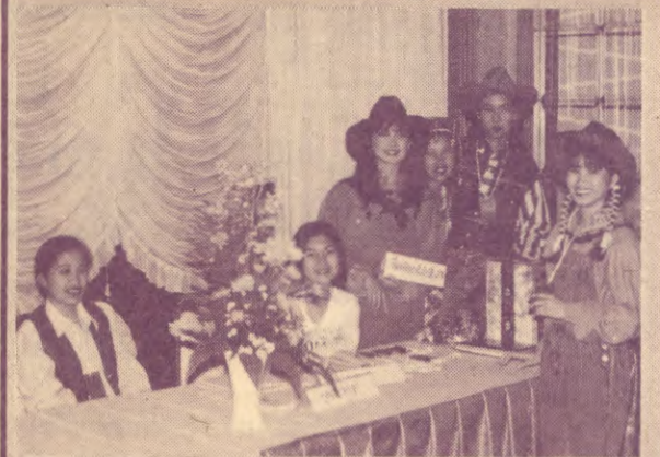
PR สังสรรค์ กลุ่ม PR ฟ้ารามฯ จัดงาน PR COWBOY NIGHT เพื่อสังสรรค์ระหว่างรุ่นพี่กับรุ่นน้อง และหารายได้ช่วยเหลือเด็กยากจน เมื่อวันที่ 11 กุมภาพันธ์ 2538 ณ โรงแรมชาลีนา